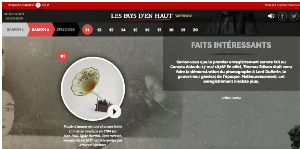
Figure 1 : Les pays d'en haut , le webdoc

quel point les identités du format sont multiples. En marge de la diffusion de la télésérie historique Les pays d'en haut , le diffuseur Radio-Canada a mis en ligne un webdoc évolutif 7 qui présente du contenu informatif complémentaire à l'intrigue télévisuelle. Il s'agit d'un projet qui s'inscrit dans une logique transmédiatique. Ainsi, alors que l'un des personnages découvre le phonographe dans l'épisode 11, on retrouve dans le webdoc des informations sur l'invention de Thomas Edison (figure 1). Ces données sont transmises par du texte, des extraits sonores, des images fixes et en mouvement - autant d'archives que de fiction, le tout présenté sur une page déroulante qui a les apparences d'un site web.