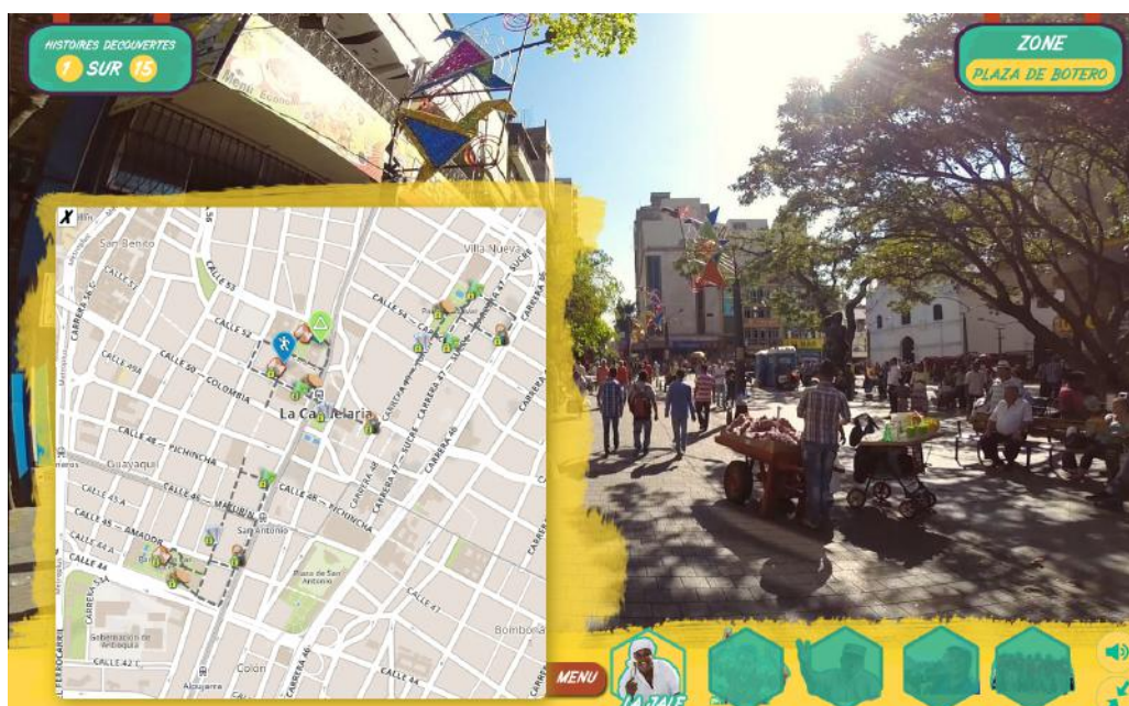
Figure 2 : Pregoneros de Medellín

Le synopsis de l'œuvre interactive décrit le rôle du spectateur de la façon suivante : « il crée [...] une expérience documentaire personnelle. Il est libre d'aller, venir, de faire marche arrière, et de chez lui, rencontrer la diversité de la ville, la contempler et l'écouter, à travers la voix de ses habitants 9 ». En raison des modalités de navigation, on a en effet l'impression d'une immersion virtuelle. La lecture se fait par une navigation en solitaire dans un environnement digital où ni le trajet, ni le point d'arrivée, ne seront les mêmes pour chacun des interacteurs. Si le documentaire a la réputation d'être sérieux, Pregoneros de Medellín mobilise le spectateur non seulement dans le rôle d'un interacteur, mais également d'un joueur au sein d'un environnement ludique.