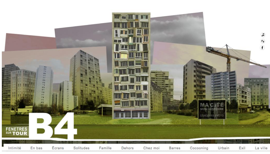
Figure 7 : B4 Fenêtres sur tour

Le webdocumentaire B4 Fenêtres sur tour réalisé par Jean-Christophe Ribot en 2012 propose un portrait de douze locataires vivant en banlieue parisienne. Les courtes séquences vidéo sont présentées dans une interface à l'image d'un immeuble de banlieue parisienne (figure 7), où le spectateur découvre le contenu en cliquant sur les fenêtres. Il s'agit d'une représentation d'existences fragmentées qui se trouvent unies par le dispositif. Les mêmes séquences sont aussi regroupées par thème, au bas de l'écran.