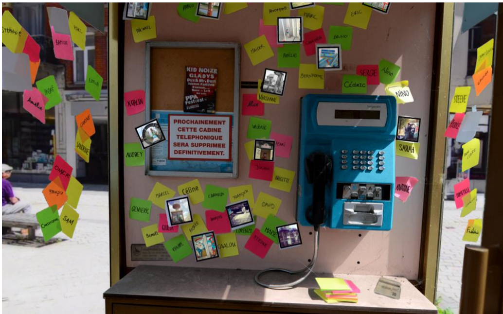
Figure 6 : Histoires de cabines

Une fois la séquence linéaire d'introduction passée, une interface représentant trois cabines s'affiche et on comprend que l'on doit en choisir une pour poursuivre notre parcours. En cliquant par exemple sur la cabine confiance , nous sommes transportés à l'intérieur d'une cabine où de nombreux post-its colorés (figure 6) ont une fonction performative : en agissant sur eux, le spectateur active le dispositif.