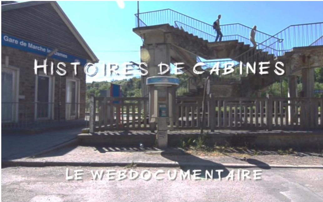
Figure 5 : Histoires de cabines