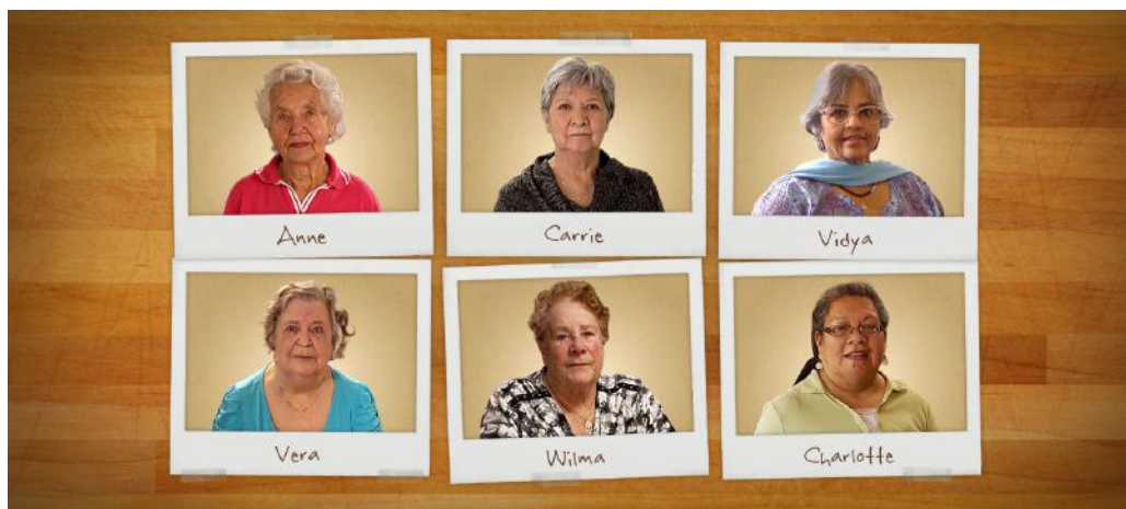
Figure 3 : Pain

est invité à choisir la vidéo qu'il visionnera en premier (figure 3).