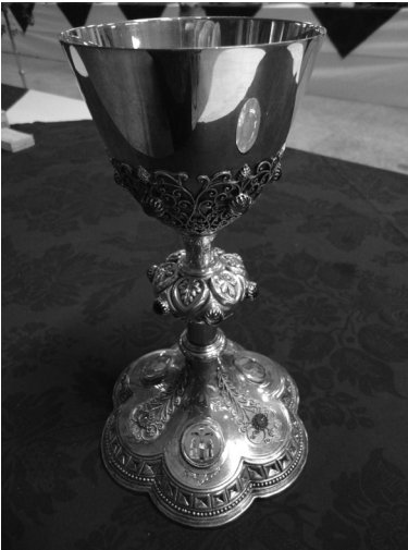
Calice (Collection patrimoniale de l'IUSMM, photographie C. Bolduc)

Le temps a laissé d'autres objets, plus ou moins insolites, dans les sous-sols de l'IUSMM, que ce soit de l'équipement médical, des instruments de chirurgie, des sceaux, des meubles, des statues et même la cloche de la paroisse St-Jean-de-Dieu 4 ! Les objets sacerdotaux y sont nombreux et forment même une sous-collection contenant diverses pièces comme des burettes, des cloches, des chandeliers, un ostensorio ou tous les vêtements sacerdotaux pour les saisons et les fêtes religieuses. L'Institut conserve également des calices, dont celui-ci qui date de 1899 :