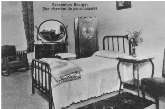
Chambre privée (Collection patrimoniale de l'IUSMM)

Outre les dossiers des malades et les registres d'admission et de décès, la collection patrimoniale de l'IUSMM contient le bulletin du superviseur de l'anatomie depuis 1885, les bulletins de décès depuis 1923, les rapports hebdomadaires depuis 1890, les listes trimestrielles pour le gouvernement (pour quelques années seulement vers la fin du 19 e siècle), les formulaires d'admission, la correspondance entre le surintendant médical et les officiers du gouvernement, les familles, les mairies et, plus surprenant, un vieux dictionnaire Larousse retrouvé dans le plafond d'un ancien dortoir! Parmi les trésors de cette collection, on compte également un livre manuscrit des Sœurs, intitulé Adresses et dialogues et composé de poèmes, de pièces de théâtre 2 et autres écrits des religieuses, ainsi que le scrapbook du Dr George Villeneuve (1866-1918) qui fut le surintendant médical de Saint-Jean-de-Dieu à partir de 1894. Ce scrapbook contient des notes de lectures ou d'observations des malades, ainsi que des ébauches de lettres manuscrites et des coupures de journaux relatant les cas de folie criminelle qui ont suscité l'intérêt du Dr Villeneuve.