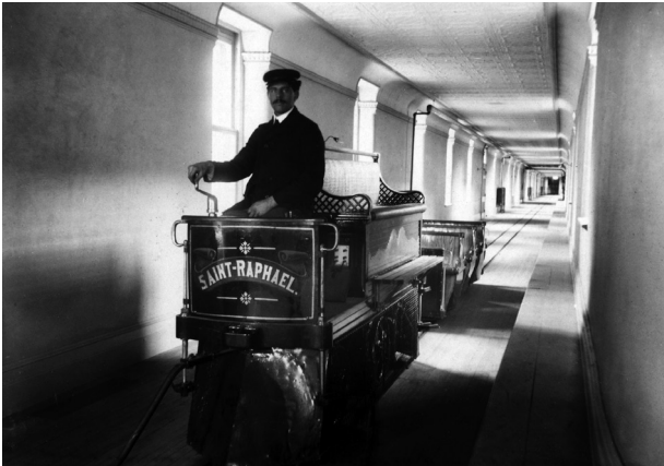
Copie de la photo phare du train intérieur, Le Saint-Raphaël

Outre les armoires de documents et les centaines de mètres de rayonnage conservant les dossiers de milliers de patients (plus de 192 000 dossiers 3 !), la collection patrimoniale de l'IUSMM recueille également de nombreux et divers objets. Ce sont tout d'abord quantité d'archives iconographiques et médiatiques qui dorment dans les armoires de la salle des archives précieuses. Des photographies, par dizaine, mais aussi, des négatifs, plusieurs cartes, des plans, ainsi que des enregistrements audio et vidéo ont été conservés au fil des années. Parmi ces archives matérielles, on peut retrouver une très vieille collection de diapositives d'enseignement en médecine ainsi qu'une plaque faite par un patient au sujet de la découverte de Toutankhamon et retrouvée entre les murs lors d'une rénovation. Malheureusement, certaines pièces de cette collection ont été perdues, comme la photo phare du train intérieur, le Saint-Raphaël, qui a été égarée lors d'un partage avec un autre service de l'institution. Désormais, aucune pièce originale ne sort de la collection. Tout partage se fait dorénavant en format numérique. Pour ce faire, nous nous appliquons, encore aujourd'hui, à numériser, de manière bénévole, les nombreuses photographies ainsi que les négatifs présents dans la collection.