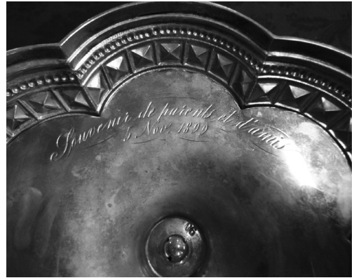
Inscription sous le calice