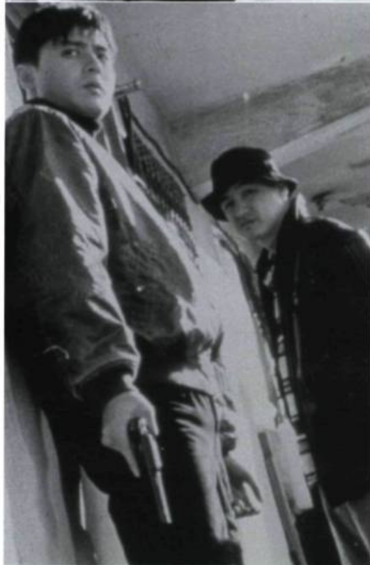
Nowhere to Hide