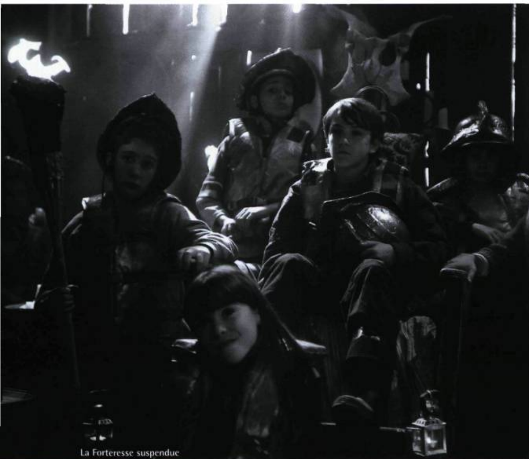
La Forteresse suspendue