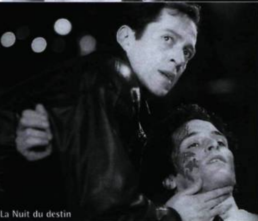
La Nuit du destin

dra surtout son souci de capter les mœurs de ses contemporains avec le plus de naturel possible (voir la scène dans l'ascenseur entre les deux amants gais). Pour un premier film, Nuit de nocces s'avère une comédie estivale entraînante, dynamique et d'une élégance inhabituelle.