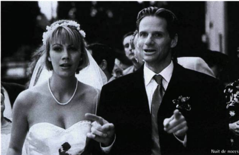
Nuit de nocces