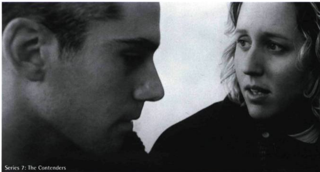
Series 7: The Contenders