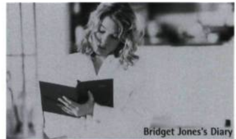
Bridget Jones's Diary

Ce qui frappe d'abord dans Café Olé , c'est l'absence de toute référence culturelle à la société montréalaise ou de toute référence au monde réel. Le typique débat sur la langue est ici évacué d'une façon