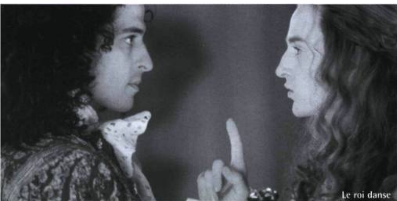
Le roi danse