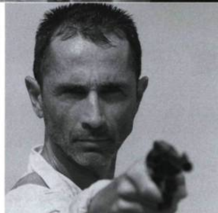
Le Prince du Pacifique

Partant de ces prémisses, Le Prince du Pacifique joue autant avec la mentalité impérialiste et militaire de la France coloniale, les légendes et les coutumes polynésiennes, qu'avec la bonne vieille cupidité bourgeoise. Truculent parfois (Lefebvre ne se gêne pas pour abattre à bout portant un de ses officiers) et souvent ironique (madame de Morsac, ne voulant pas interrompre un opéra, meurt malencontreusement étouffée), le film se développe, aidé par d'excellents interprètes, à un rythme trépidant.