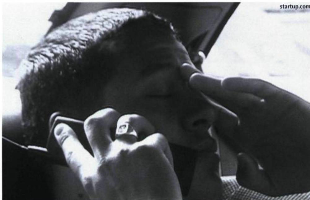
Thomas est amoureux

Thomas est amoureux , c'est aussi le réalisateur Pierre-Paul Renders, qui opte pour le cadre fixe et le plan-séquence qui lui permettent d'élaborer la dualité possible des rapports au monde rassurants/inquiétants de Thomas, par des jeux de cadrage, de flou, de réglage et, donc, de fausse subjectivité, que rendent possible la manipulation des espaces visuels — décor, lumière, couleur, profondeur de champ, etc. — et sonores, ainsi que l'exploration de différents supports, tons et rythmes.