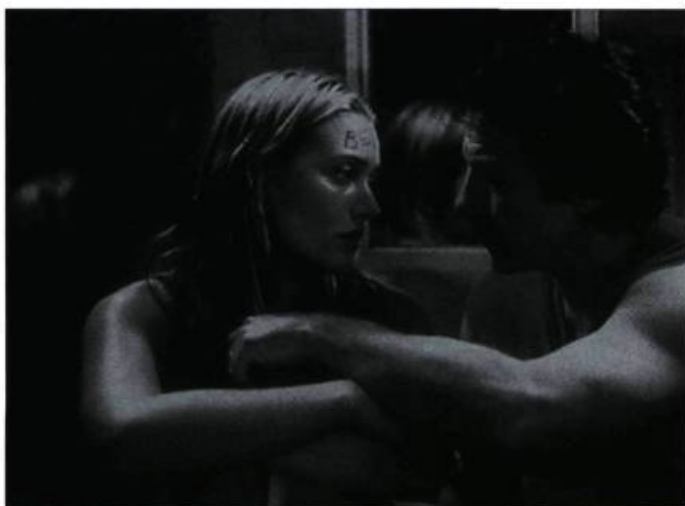
Un jeu de séduction