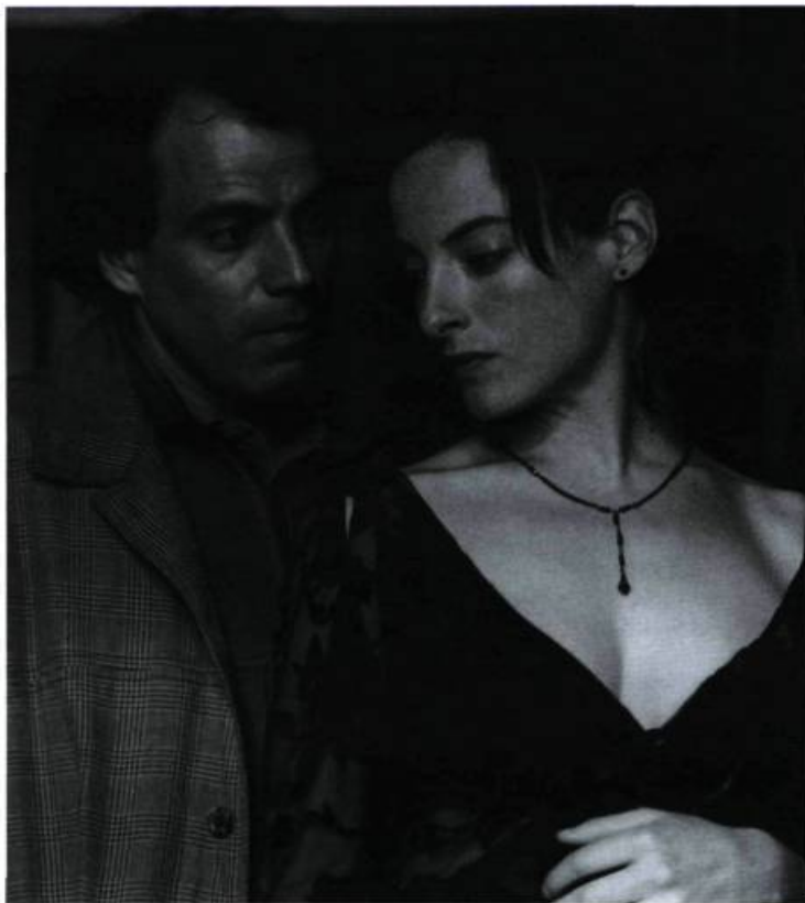
Des personnages cernés par la peur et la mort

Regards-inquiets-mais-flous-vers-un-futur-sombre-et-nébuleux