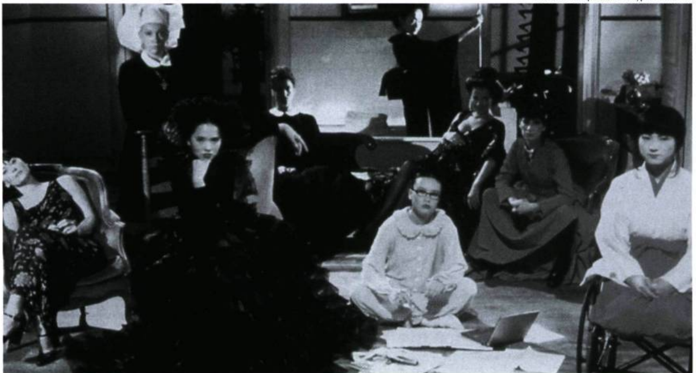
Tableau statique d'archétypes féminins

8 1/2 Women baigne dans l'univers habituel de Peter Greenaway, un monde décadent, hanté par Éros et Thanatos, peuplé de personnages quasi irréels qu'animent leurs obsessions, généralement charnelles. Après la mort de sa mère, Storey Emmenthal, gérant des salles de jeux japonaises dont a hérité son père, Philip, un riche homme d'affaires genevois, transforme leur maison de famille de Genève en bordel privé et y initie son paternel à la lubricité.