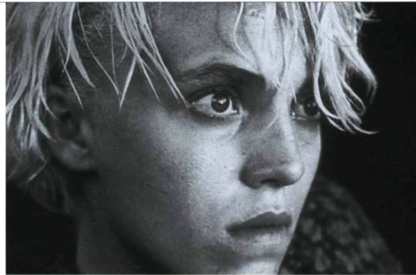
Une poésie qui fait appel à des zones obscures

À la manière d'un film noir à l'accent blues, Sombre nous entraîne dans les méandres tortueux de la pensée de Jean, une pensée qui n'a d'autre logique que celle de la schématisation du meurtre. Le film s'attache au destin de ce meurtrier que l'on n'a pas voulu attachant, mais qui réussit pourtant à émouvoir les femmes qu'il rencontre à un degré tel que, lorsque Claire se jette dans ses bras après qu'il eut tenté de violer et de tuer sa sœur, cela