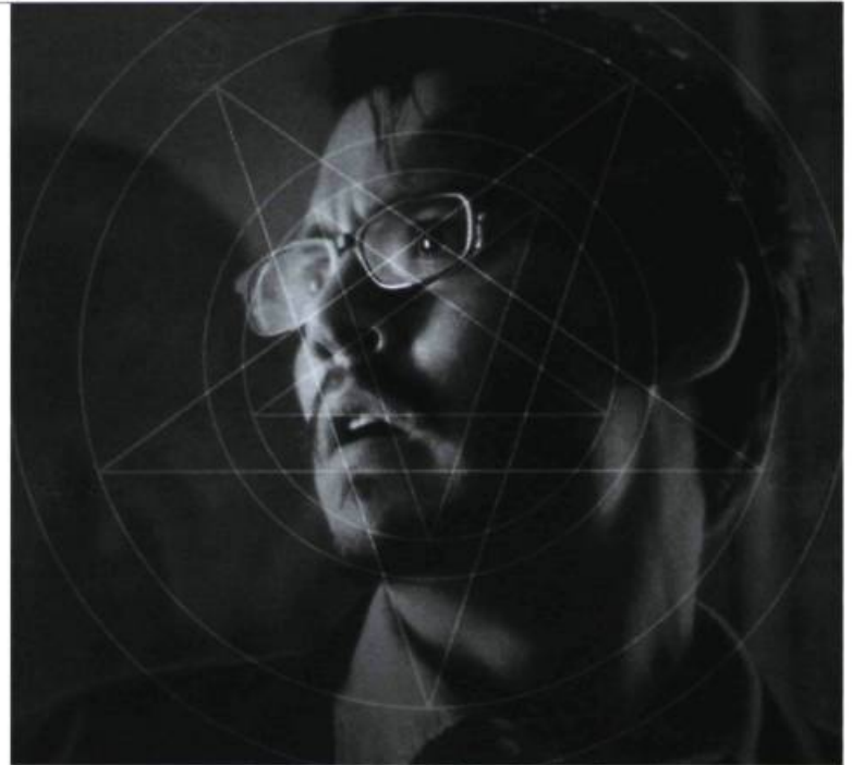
L'univers de l'insolite et de l'occulte

S'il est vrai qu'une histoire comme celle-ci requiert du spectateur qu'il laisse aller son imagination et qu'il accepte de croire temporairement à une réalité plutôt incroyable, il est tout de même essentiel que la structure du récit et que l'univers qui y est créé soient cohérents. Malheureusement, dans ce cas-ci, les rebon-