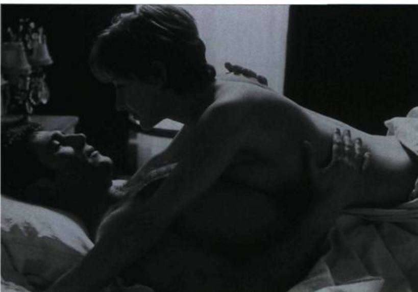
N'exister qu'en fonction du regard de l'autre

Iran/France 1999, 118 minutes — Réal. : Abbas Kiarostami — Scén. : Abbas Kiarostami — Photo : Mahmoud Kalari — Mont. : Abbas Kiarostami — Mus. : Peyman Yazdani — Son : Jahangir Mirshekari, Mohamad Hassan Najm — Int. : Behzad Dourani (l'ingénieur) et les habitants de Siad Dareh (Kurdistan d'Iran) — Prod. : Marin Karmitz, Abbas Kiarostami — Dist. : Remstar Distribution.