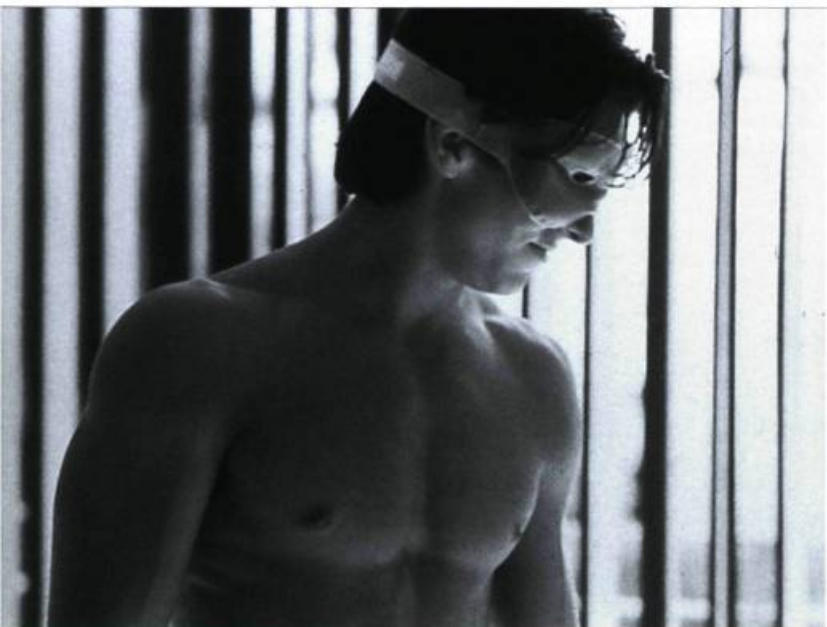
Bateman...rien d'autre qu'un masque de beauté