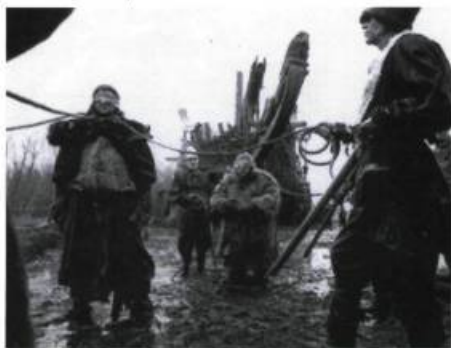
The Flying Dutchman

Le réalisateur hollandais Joe Stelling ( The Pointsman , L'illusionniste ), vient de terminer le tournage de De Vliegende Hollander ( The Flying Dutchman ), une production à gros budget inspirée de la légende du Hollandais volant. Cette épopée fantaisiste, qui se situe dans la lignée des films de Terry Gilliam, devrait sortir dans le courant de l'année prochaine. Le budget de six millions de dollars en fait le film le plus coûteux jamais tourné aux Pays-Bas.