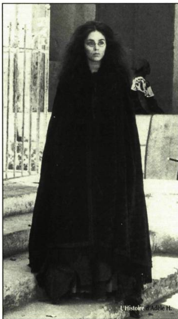
L'Histoire d'Adèle H.

nable, lisse et sans âge. Une beauté métissée qu'elle avouera tard. Issue d'un mariage mixte, d'une mère allemande et d'un père kabyle, ce n'est que dernièrement qu'elle en parle publiquement, comme si elle voulait se défaire d'une imposture et réparer un tort dont personne ne lui tenait rigueur de toute façon! Étrange aussi cette rumeur persistante qui, en 1987, affirme qu'elle se meurt du sida. Elle est absente des écrans depuis longtemps et les journaux à potins la forcent à quitter sa retraite pour apporter un démenti formel. Ce qu'elle fait au journal télévisé de 20 heures, le plus regardé en France, comme s'il s'agissait d'une affaire d'État! Et c'est en récitant du Salman Rushdie qu'elle va recevoir son César pour Camille Claudel , en 1989. Ce ne sont là que quelques anecdotes, mais ô combien parlantes! Avec ces trois histoires aussi singulières que le personnage lui-même, on est en droit de se demander à quel