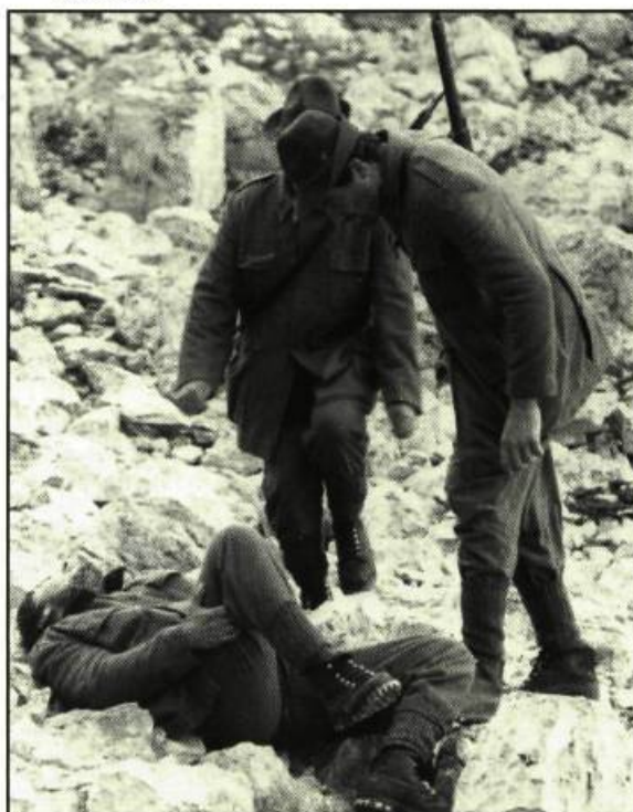
Barnabo delle montagne de Mario Brenta