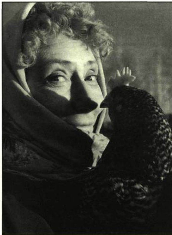
Riaba ma poule de Andrei Konchalovsky

La Reine de la nuit , une laborieuse descente aux enfers.