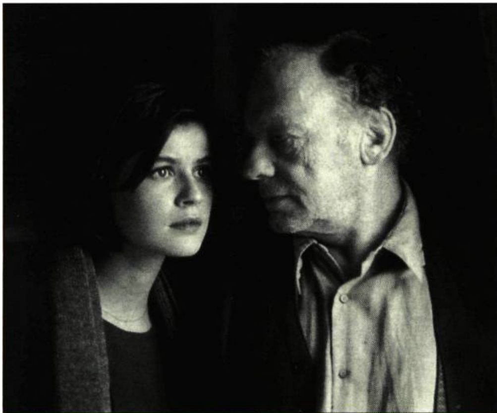
Rouge de Krzysztof Kieslowski

Le titre est habilement choisi. Comment concilier des siècles de culture et de vie sociale enracinées dans le confucianisme avec la croissance économique vertigineuse qu'a connue Taïwan? Si les gens de Taïwan continuent à manger avec des baguettes, ils ne refusent pas de prendre le taxi. En fait, ils n'ont pas oublié l'affirmation de Confucius: «Un Chinois heureux est un Chinois riche». Bien que Taïwan ait connu un boom remarquable après la Seconde Guerre mondiale, il n'est pas dit que tous les habitants se promènent en décapotable. Nous sommes en présence d'une famille où les membres travaillent dans la publicité, le théâtre et l'édition. Et sur le ton de la comédie, le cinéaste évoque la névrose des jeunes personnes que l'on retrouve souvent autour d'une table dressée. Les nombreux personnages ne permettent pas une lecture facile, alors que les disputes surgissent. Edward Yang place ses personnages devant la caméra et ils parlent, ils parlent, ils parlent. Pendant plus de deux heures, nous assistons à des «débats» où les sentiments se heurtent. Serez-vous surpris si je vous dis que la salle s'est vidée de moitié? C'est tout dire. ☆