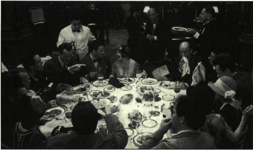
Mrs Parker and the Vicious Circle d'Alan Rudolph

Il est toujours au service de la collectivité. Ainsi le héros de Vivre va passer de l'obsession du jeu à la vie commune où il connaîtra les joies et les difficultés d'une famille. En fait, Yimou n'a pas réalisé ce film pour séduire les étrangers, il l'a fait avant tout pour ses compatriotes afin qu'ils puissent se reconnaître. Hélas! à ce jour, le film est interdit dans son pays. De plus, on ne lui a pas permis de venir présenter son film à Cannes. On a délégué ses deux protagonistes. Si cela peut le consoler — sans compromettre sa carrière — son héros a reçu le prix du meilleur interprète et le jury oecuménique a décerné son prix à Vivre!