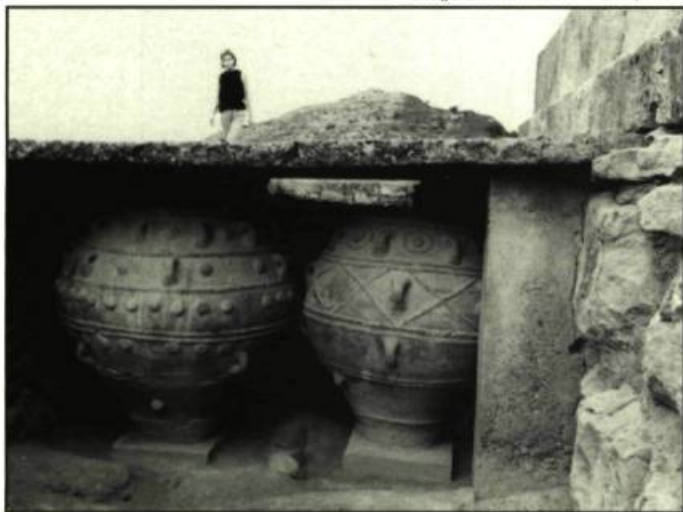
Le Singe bleu d'Esther Valiquette

aura été la fiction 10:32 on Tuesday (Anette Kristina Olesen, Danemark). La réalisatrice illustre avec authenticité et une immense sensibilité les angoisses d'une jeune femme qui décide de déménager chez son copain. Le film aborde avec intelligence et émotion les notions de perte d'identité, d'incertitude dans l'amour et dans le couple, ainsi que de séparation du milieu familial. Homo videocus (Je-Yong Lee et Hyuk Byun, Corée du Sud) aura sans doute plu aux divers intervenants qui s'inquiètent des effets de la télévision sur les jeunes. Ici, un adolescent au visage livide regarde continuellement la télévision. À tel point qu'il en perdra jusqu'à son identité. L'humour de ce film devient rapidement troublant. The Lake (Stefen Schwartz, Grande-Bretagne) est à ce point classique qu'il ressemble à un téléfilm. Cela n'est cependant pas un reproche, loin de là. Le film de Schwartz est d'une absolue rigueur et d'un suspense langoureux. Ici, le cinéaste raconte l'histoire d'un journaliste qui voulait trop savoir sur une certaine artiste-peintre qui semble considérer le meurtre comme acte créateur. Le réalisateur a cependant paru menotté par le format (le film dure 30 minutes). The Lake aurait exigé au moins trente minutes de plus pour atteindre un niveau de tension maximum.