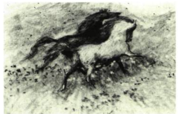
L'Homme qui plantait des arbres

Enfin, la qualité des projections a sérieusement laissé à désirer: combien de fois a-t-on crié dans la salle parce que le son manquait au début du film, que l'image n'était pas au point ou que les masques en cachaient une partie? Les projections de vidéos faisaient pitié: les oeuvres étant généralement courtes, on avait à peine le temps de s'ajuster à la petitesse de l'image et à sa piètre définition qu'elles étaient déjà disparues. Si on ne peut faire mieux, peut-être vaudrait-il mieux oublier la vidéo car, dans de telles conditions, cela ne rend pas justice à leurs créateurs.