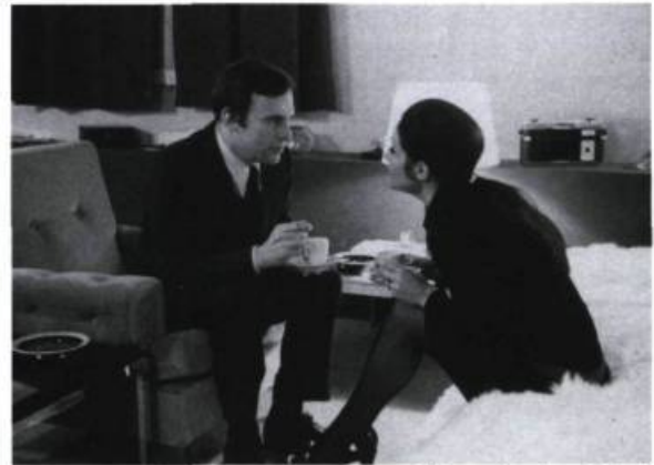
Ma nuit chez Maud

Jérôme déclare ne pas prêter attention à l'amour qu'éprouve la jeune Laura à son égard. De même Jean-Louis insiste sur le fait que « courir les filles, ça ne vous éloigne pas plus de Dieu que faire des mathématiques ». Pourtant, le premier, tout en étant troublé, obsédé par le genou de Claire, accompagne volontiers Laura dans ses promenades et ne manquera pas l'occasion de l'embrasser. Le second poursuit Maud de ses assiduités, l'embrasse aussi, presque comme pour se faire pardonner sa maladresse de la nuit précédente. Des hasards bien préparés, menant à des actions attendues jouées sur le ton badin de l'improvisation la plus naturelle.