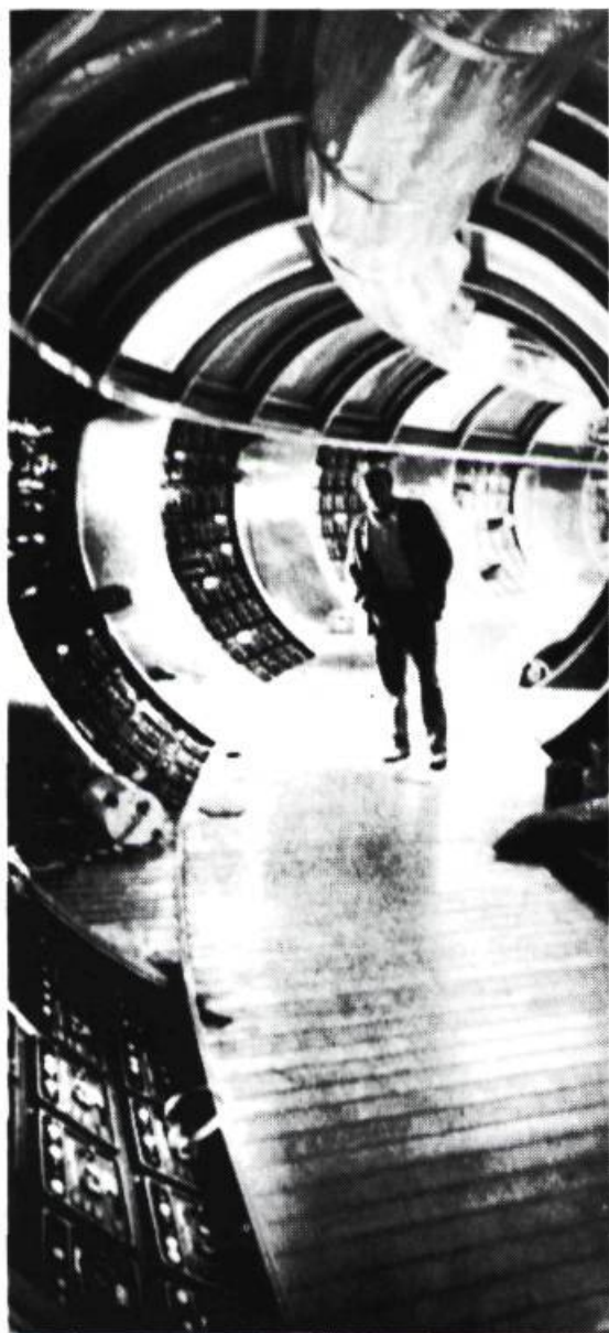
Solaris, d'Andrei Tarkowski