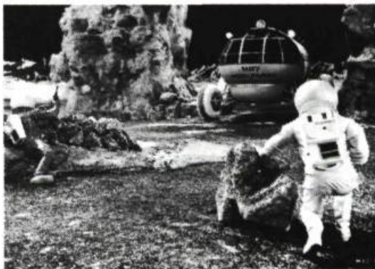
Moon Zero Two , de Roy Ward Baker

Après la lune, on s'avisa de l'existence des autres planètes du système solaire: Mars, d'abord, qu'en 1960 Ib Melchior nous présente sous le titre Angry Red Planet — mais en l'occurrence, ce n'est pas à Mars qu'il s'en prend, mais au spectateur! Ce serait plutôt à lui d'être "angry" (fâché) de-