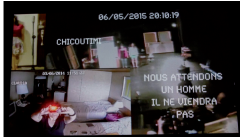
Photo 4 - "Image de la composition web".

son micro-cravate s'intègre aux cassures presque délicates de la chaise. La quatrième performeuse chez elle à Bogotà est projetée en grand sur le mur face aux spectateurs. Silencieusement, elle nous montre avec sa webcam une série de photos. Quand la deuxième performeuse écarte les panneaux elle apparaît démesurée, excessive et projette très fort à voix nue l'histoire d'une femme en quête de plusieurs hommes. Peu avant, la troisième avait lancé déjà plus fort la chaise contre le mur. De son côté, la première debout contre une maquette construite à la va vite et dans laquelle elle a installé les deux photos choisies, actionne une petite boîte à musique tout en émettant un râle orgasmique amplifié par son micro. Elle est soutenue par la quatrième à Bogotà qui, le visage contre le portrait d'une femme, est prise d'un rire de plus en plus puissant. Pour participer à cet ensemble hétérogène et conflictuelle, Guillaume lance un thème musical qui rapidement intensifie sa cadence et son volume. Sous l'effet de cette saturation musicale, les actions perdent peu à peu leur détail sonore et on voit la femme excessive (appelée La Démasiada) qui tout en poursuivant sa harangue mettre à terre tous les panneaux qui structuraient le plateau. Celui-ci finit défait, dans le noir et le silence comme à l'écoute des vibrations de la masse sonore qui vient de nous traverser. Chacune des performeuses a dessiné un parcours autonome mais dans la même période et le même espace scénique.