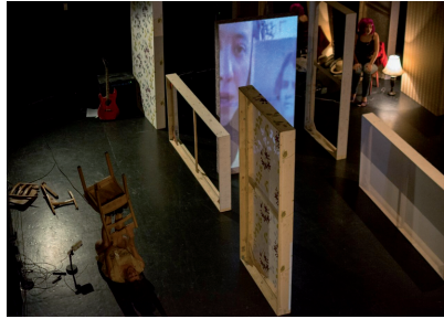
Photo 3 - “Vue plongée du plateau”.

Cartographies de l’attente est une pièce d’environ 90 minutes jouée à la fois dans un théâtre et en direct sur internet. On assiste à une sorte de résurgence narrative et sonore de la résidence au motel Parasol qui progressivement semble mise à l’épreuve par de nouvelles fictions et comme par de nouveaux enjeux scéniques et performatifs avec les spectateurs.