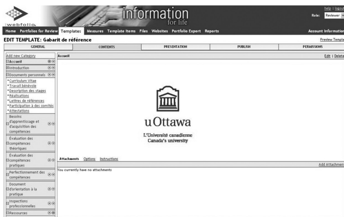
Figure 2. Tableau de bord du portfolio numérique

soutien technologique offert par Nuventive et de la facilité apparente d'utilisation. L'étudiant pouvait réaliser ses activités directement dans son portfolio numérique, insérer divers documents d'orientation à la pratique et témoignant de sa démarche d'apprentissage et de maturation, établir des liens de communication avec ses professeurs. L'étudiant trouvait, au départ, un tableau de bord (Figure 2) lui donnant accès aux différentes sections et lui permettant d'éditer les documents qu'il y insérerait. L'étudiant avait au départ les directives pour réaliser les activités et organiser l'insertion des documents témoignant de ses apprentissages, pour l'année universitaire à venir.