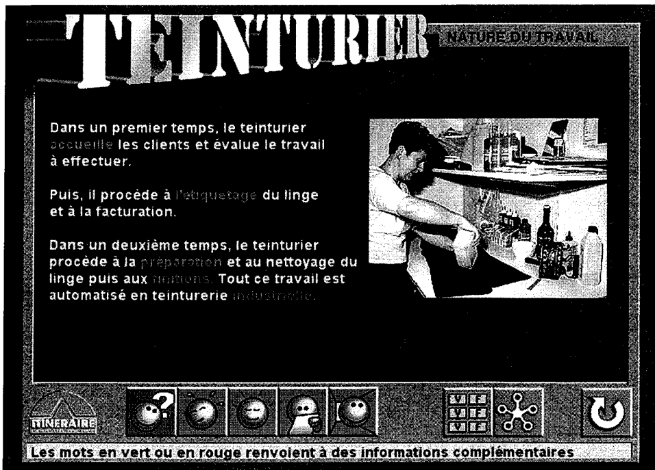
Figure 3 – Un exemple d'écran d'un des cédéroms Itinéraire

La structure est hypertextuelle avec une limite à trois en niveau de profondeur et à cinq en niveau de largeur. L'hypertexte est muni d'un index et de deux tables de contenus actives: l'une graphique (entrée par les métiers), l'autre textuelle (entrée par les formations). La police de caractères utilisée est l'Helvetica 14 points gras. Chaque texte (à gauche de l'écran) est illustré par une image (à droite de l'écran). Les lignes de texte comportent 40 signes en moyenne. Les icônes sont au nombre de huit, disposés en ligne en bas de l'écran, et leur fonction s'affiche en bas de l'écran chaque fois que la souris passe sur eux. Le fond d'écran n'est pas blanc mais bleu afin d'obtenir un meilleur contraste avec les mots-boutons verts et rouges.