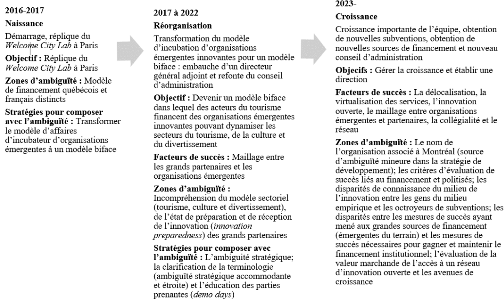
Figure 1 – Description des périodes du MT Lab

Le développement de programmes soutenant les organisations émergentes incite la création de postes. Le modèle d'incubation, spécialisé dans les secteurs du tourisme, de la culture et du divertissement, est la deuxième source d'ambiguïté avec laquelle composer. Le fait que le MT Lab se présente comme un incubateur pour dynamiser ces secteurs a initialement été interprété de plusieurs manières. Une personne répondante (R5) nous explique que la culture peut inclure des musées, mais c'est également des centaines de milliers de touristes par année. Dans le cas du MT Lab, des artistes contemporains ont cherché à être incubés. Il était clair pour l'équipe que des artistes contemporains n'étaient pas le type d'entreprise recherché puisque l'organisation cherchait à dynamiser lesdits secteurs avec des organisations innovantes qui sauraient les soutenir (p. ex., des entreprises technologiques pouvant aider des hôtels, des musées, des organisations touristiques, des centres de congrès, des festivals, etc.). Pourtant, le message communiqué amenait des artistes à croire qu'il s'agissait d'un incubateur culturel.