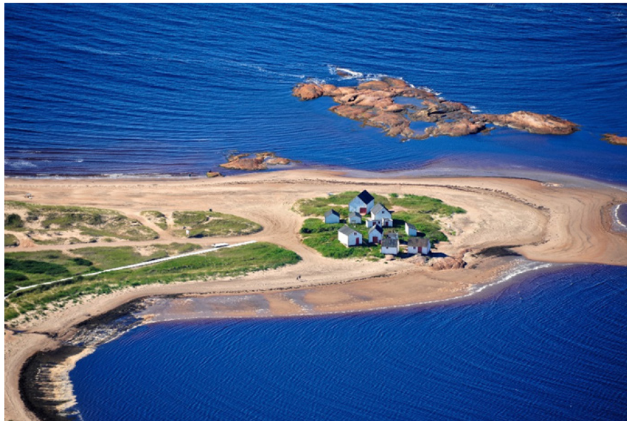
Les Galets de Natashquan, sur la Côte-Nord

Paul Gagnon. Il trouvait important de réaliser un inventaire pour appuyer les démarches de protection du patrimoine. Dans ce processus, l'aspect visuel des sites ou des bâtiments apparaissait comme primordial. Or, on nous avait imposé un échéancier de cinq ans pour réaliser un inventaire, ce qui est très court. Ce contexte nous a amenés à faire le choix d'utiliser l'avion pour prendre des photographies aériennes. Nous nous sommes inspirés en cela des méthodes employées en Pologne, où l'on a mis à contribution des hélicoptères, et de certaines expériences françaises effectuées par avion, notamment la pratique de l'archéologie aérienne par Roger Agache (Malgras, 2022). Pour ma part, j'ai rapidement eu la piqûre de l'avion et des prises de vues aériennes. C'est pratiquement devenu une mission personnelle de faire un portrait des paysages du Québec par voie aérienne!