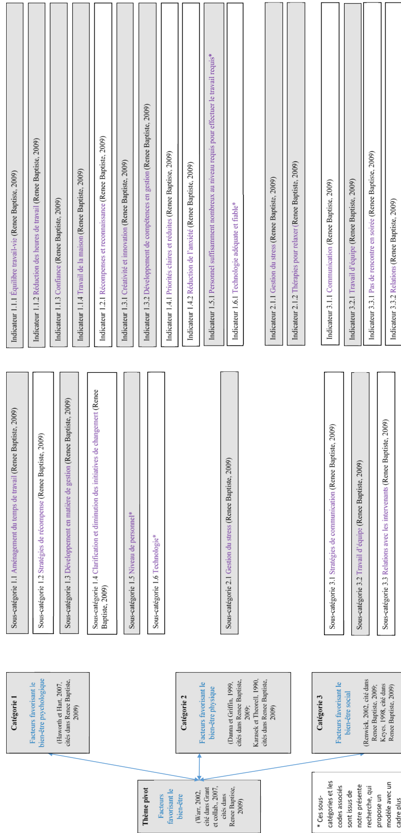
Figure 1 – Cadre conceptuel et thématique