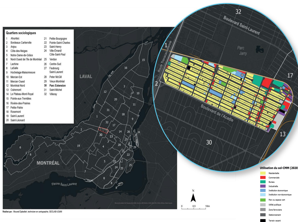
Carte 1 – Localisation et utilisation du sol du quartier Parc-Extension

La carte 1 montre également que le quartier est fortement résidentiel (en jaune sur la carte). En effet, seulement 14 % du territoire est à vocation industrielle ou commerciale. La majorité des immeubles sont des duplex et multiplex de 4 à 12 logements (Favretti, 2011). Centraide du Grand Montréal (2020) indique : « Malgré le coût moyen des appartements nettement plus bas que la moyenne montréalaise, une forte proportion (40 %) des ménages locataires du quartier consacrent plus de 30 % de leurs revenus au loyer » (p. 3), soit au-delà de la limite d'abordabilité définie par Statistique Canada (2016). De plus, 17,1 % des résidents et résidentes de Parc-Extension considèrent habiter un logement de taille insuffisante,