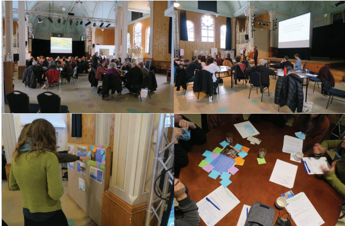
Figure 2 – Forum citoyen de Saint-Camille tenu le 27 novembre 2021

Ensuite, les initiatives ayant suscité le plus d'intérêt ont été examinées afin de déterminer s'il s'avérait pertinent de les documenter. Si cela a été le cas pour plus de la moitié, pour d'autres, cela apparaissait moins intéressant. Par exemple, les réfrigérateurs communautaires, où les gens sont invités à déposer leurs surplus alimentaires pour que des personnes dans le besoin puissent les récupérer, ont intéressé les personnes de Saint-Camille. Toutefois, bien qu'une telle initiative puisse revêtir certains enjeux, notamment d'emplacements possibles et souhaitables, ceux-ci ne sont pas apparus suffisamment complexes pour justifier leur documentation. Par ailleurs, les responsables d'une autre initiative n'ont pas pu être joints, malgré de nombreuses tentatives. Enfin, il est apparu qu'une initiative n'était finalement plus active. À la suite de cette séance de coconstruction, d'autres initiatives à documenter ont été identifiées par l'équipe de recherche, par la CODESESCA et par les personnes de Saint-Camille participant aux rencontres des ASP.