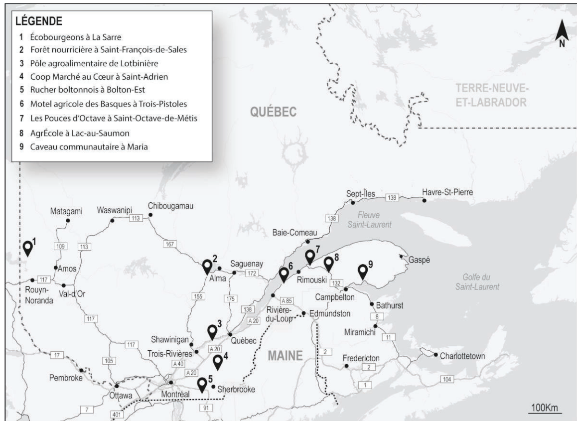
Carte 1 – Neuf initiatives inspirantes pour Saint-Camille