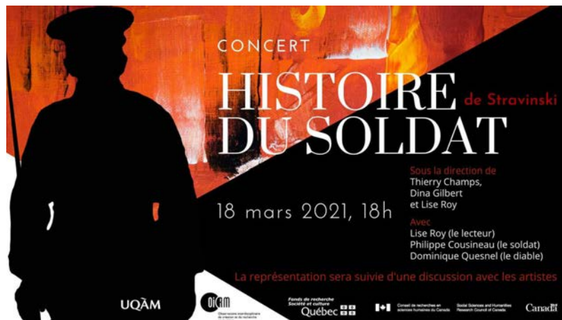
Figure 1 : Affiche officielle de l'événement-concert.