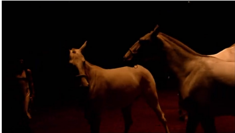
Extrait vidéo 9 : Bartabas, Triptyk, Le Sacre du printemps, « Second tableau. Introduction » (extrait), 00:19:52 à 00:20:02. © Bartabas, MK2.

Dans le troisième mouvement de la Symphonie de psaumes , Bartabas rythme l'espace scénique par différentes couleurs et mouvements avec une polyphonie équestre. Il alterne ainsi des chevaux couleur crème et des chevaux marron dont les pas soulignent la pulsation. La stabilité du tempo, marquée par la marche régulière des chevaux s'entremêle à un mélange de couleurs. Différents croisements et mouvements symétriques, parfois en sens contraire, soulignent la variété des motifs thématiques, les subtilités contrapuntiques et la richesse de la polyphonie utilisées par Stravinski (extrait vidéo 10).