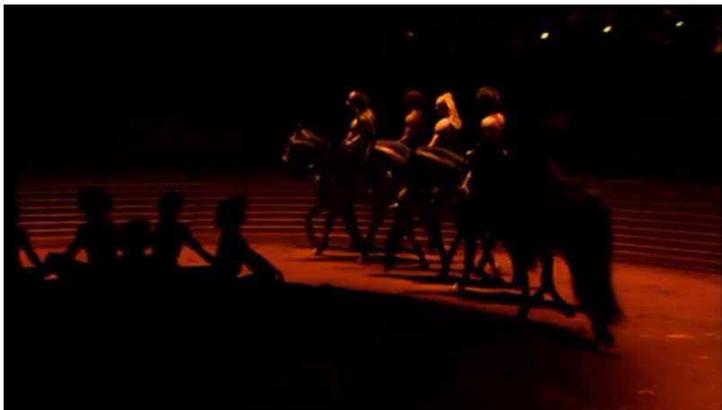
Extrait vidéo 5 : Bartabas, Triptyk, La Symphonie de psaumes, « Premier tableau. Danse des adolescentes » (extrait), 00:05:36 à 00:05:40. © Bartabas, MK2.

Un « contrepoint équestre » se développe tout au long du spectacle. En effet, plusieurs passages du Sacre et de la Symphonie de psaumes utilisent une écriture en imitation et Bartabas positionne ses chevaux côte à côte, avec un léger décalage entre eux, qui peut symboliser les motifs musicaux qui apparaissent avec un léger écart (voir extraits vidéo 5 et 6).