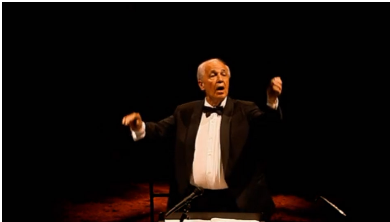
Extrait vidéo 12 : Bartabas , Triptyk , La Symphonie de psaumes , deuxième mouvement (extrait), 00:58:57 à 00:59:37.

À ce titre, les mouvements circulaires et répétitifs de la mise en piste nous entraînent dans une perception des carrures plus générale, comme pour la « Danse des adolescentes » (voir extrait vidéo 7). La mise en piste de Bartabas traduit simultanément une perception globale de la structure musicale, tout en mettant en valeur des détails de l’écriture musicale.