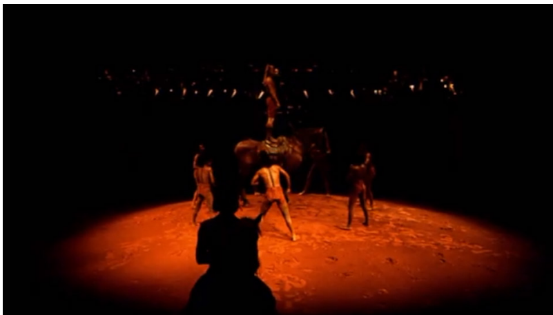
Extrait vidéo 8 : Bartabas , Triptyk, Le Sacre du printemps , « Premier tableau. Rondes printanières » (extrait), 00:09:42 à 00:09:51. © Bartabas , MK2.

L'adaptation de Bartabas comporte une dimension aérienne : voltige équestre, corde et hamac. Cela contribue à souligner la construction musicale des œuvres, tout comme les différents plans sonores. Dans sa mise en piste du Sacre , le chorégraphe associe verticalité et circularité, mouvement et immobilisme, contrainte et liberté. Ces contrastes sont souvent matérialisés par des placements chorégraphiques dans l'espace (verticaux, horizontaux et circulaires). Ainsi, lors du premier tableau, un cavalier est debout, immobile sur le cheval, tandis que les danseurs sont en cercle autour de lui, réalisant des mouvements très fluides (extrait vidéo 8). L'immobilisme du danseur peut représenter la stabilité des accords qui sont joués régulièrement sur chaque temps, tandis que les mouvements des autres danseurs correspondent à la mélodie qui se manifeste sur les contretemps. Un procédé dans le même esprit apparaît dans l'introduction du second tableau : les danseurs sont immobiles sur une corde, les uns au-dessus des autres, tandis que les chevaux évoluent librement autour d'eux (voir extrait vidéo 9).