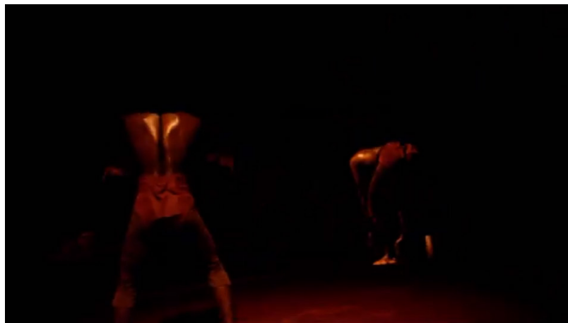
Extrait vidéo 3 : Bartabas, Triptyk, Le Sacre du printemps, « Premier tableau. Introduction » (extrait), 00:02:06 à 00:02:33. © Bartabas, MK2.

Bartabas rend « visible » la musique par divers procédés. Dans « Action rituelle des ancêtres », il fait marquer la pulsation par les pas d'un cheval et des interventions instrumentales sont traduites visuellement par les roulades en arrière des danseurs (voir extrait vidéo 4).