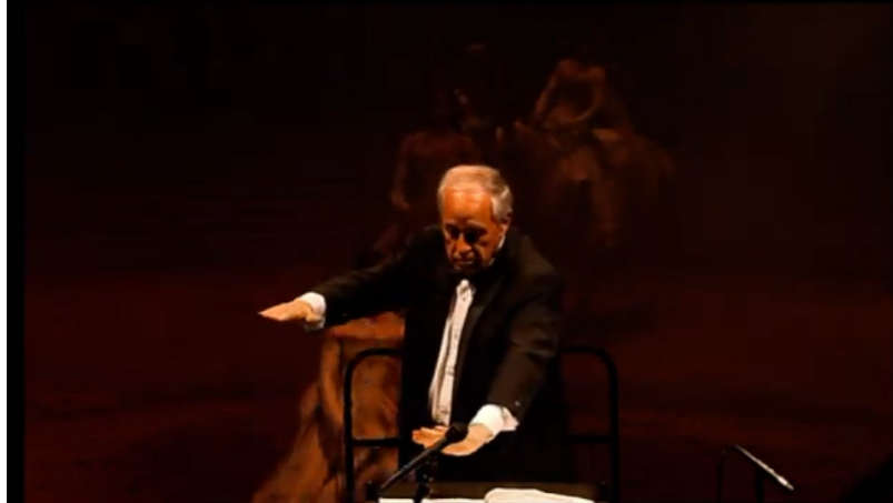
Extrait vidéo 6 : Bartabas, Triptyk, Le Sacre du printemps, premier mouvement (extrait), 00:56:23 à 00:56:35.