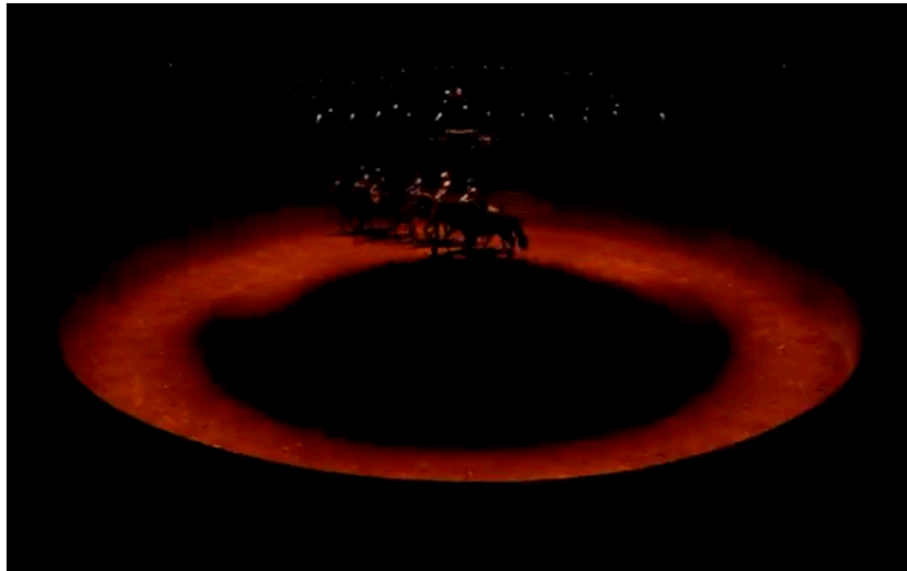
Figure 2 : Bartabas, Triptyk , Le Sacre du printemps , « Premier tableau. Danse des adolescentes », 00:05:57.

La symétrie – qui symbolise « l'unité par la synthèse des opposés » ( ibid. , p. 913) – est au cœur de cette mise en piste où les figures chorégraphiques et équestres symétriques sont nombreuses au sein de la piste circulaire. Cette symétrie alterne avec des moments asymétriques, ce qui correspond à la musique de Stravinski. Ainsi, dans son analyse du Sacre , Boulez détaille notamment des « symétries [qui] se développent dans l'asymétrie » et des superpositions de rythme se déployant sur une structure rythmique fixe (Boulez 1966, p. 101 et 113). La mise en piste de Bartabas rejoint cette perception : la symétrie apparaît dans les nombreux cercles formés par les chevaux et danseurs et dans certaines postures. La variété chorégraphique rejoint les différentes superpositions et variations que l'on retrouve dans la musique.