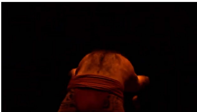
Extrait vidéo 2 : Bartabas, Triptyk, Le Sacre du printemps, « Premier tableau. Introduction » (extrait), 00:03:38 à 00:03:46. © Bartabas, MK2.

Des rapprochements sont aussi réalisés entre des solos instrumentaux et des solos chorégraphiques, comme dans cet exemple où l'intervention de la clarinette piccolo est soulignée par le mouvement (extrait vidéo 2).