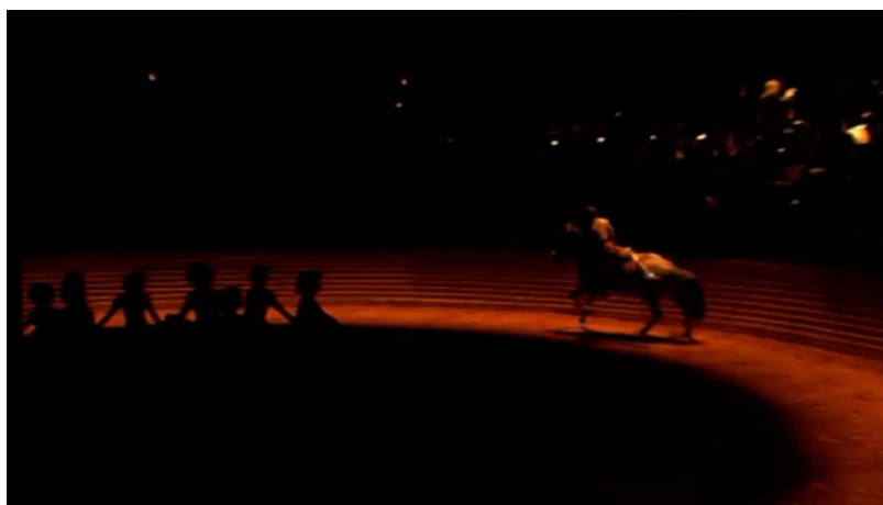
Extrait vidéo 11 : Bartabas , Triptyk, Le Sacre du printemps , « Premier tableau. Danse des adolescentes » (extrait), 00:06:29 à 00:07:01.

Cependant, si certains motifs mélodiques et rythmiques sont répétés, l'écriture de Stravinski est en perpétuel mouvement et variation : rien n'est jamais vraiment identique mélodiquement, rythmiquement, ou orchestralement. Il en est de même dans la chorégraphie et la mise en piste où la répétition du mouvement circulaire du cheval entre par exemple en contrepoint avec la chorégraphie non répétitive et verticale du voltigeur (extrait vidéo 11).