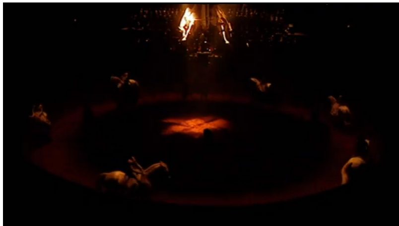
Extrait vidéo 10 : Bartabas, Triptyk, La Symphonie de psaumes, troisième mouvement (extrait), 01:07:23 à 01:07:58. © Bartabas, MK2.

Dans le troisième mouvement de la Symphonie de psaumes , Bartabas rythme l'espace scénique par différentes couleurs et mouvements avec une polyphonie équestre. Il alterne ainsi des chevaux couleur crème et des chevaux marron dont les pas soulignent la pulsation. La stabilité du tempo, marquée par la marche régulière des chevaux s'entremêle à un mélange de couleurs. Différents croisements et mouvements symétriques, parfois en sens contraire, soulignent la variété des motifs thématiques, les subtilités contrapuntiques et la richesse de la polyphonie utilisées par Stravinski (extrait vidéo 10).