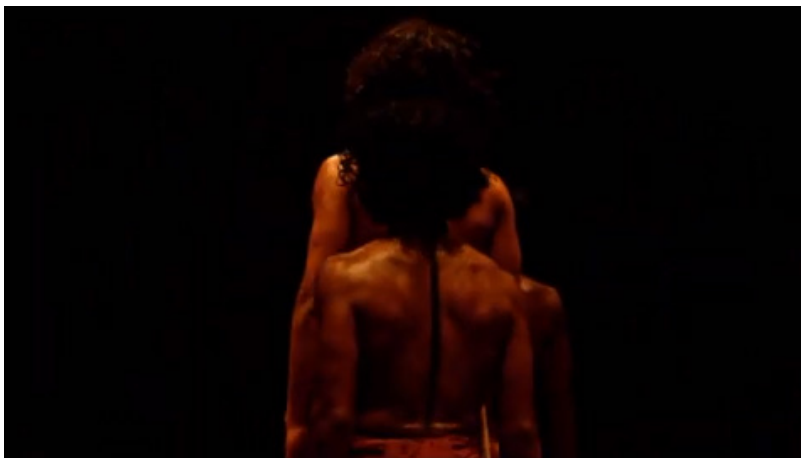
Extrait vidéo 7 : Bartabas, Triptyk, Le Sacre du printemps, « Premier tableau. Danse des adolescentes » (extrait), 00:04:38 à 00:05:13.

Bartabas transpose chorégraphiquement dans une même temporalité plusieurs éléments musicaux. Ainsi, pour la « Danse des adolescentes » (« Augures printaniers »), la version de Bartabas est très singulière dans la perception de la partition, puisqu'il met en espace – voire orchestre – de manière simultanée la répétition qui correspond à celle des accords, avec le mouvement circulaire des chevaux, encore dans la pénombre, qui évoluent autour des danseurs. Au centre de la piste, ces derniers réalisent une chorégraphie utilisant des mouvements de kalaripayattu et des passages au sol, ce qui correspond au côté tellurique désiré par Bartabas. Ce dernier n'a pas cherché à souligner chaque accent de la musique : il emploie des carrures chorégraphiques qui sont plus longues que les carrures musicales, mais qui finissent par rejoindre la structure musicale (extrait vidéo 7).