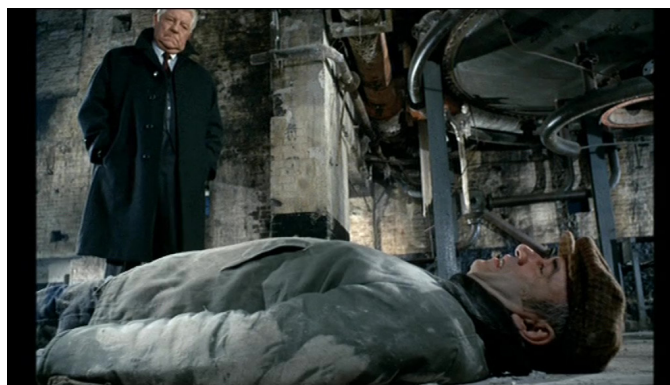
Extrait vidéo 4 : Le Pacha, 01:20:15-01:20:54, © Gaumont.

Une fois tous les truands abattus par la police, Quinquin compris, la phrase d'orgue revêt un caractère plus sérieux, solennel, plus conclusif aussi, celui d'une vengeance accomplie. Précédées d'un ralenti, les trois dernières notes, convoquant les paroles « pauvre con », sont particulièrement appuyées. Doublées par le surdo, elles sont relayées par Joss qui s'adresse à Quinquin agonisant : « Tu vois, Marcel, les bastos, c'est plus facile à donner qu'à recevoir. Je suis sûr que t'avais jamais pensé à ça » (extrait vidéo 4). « C'était de la part d'Albert Gouvion », ajoute Joss avant que sa voix off précise : « Albert les Galoches, la terreur des Ardennes, le bonheur des dames, mon pote... l'empereur des cons... ». La même phrase d'orgue, suite à ces mots, semble boucler le film, comme un retour au sens initial du requiem, où Joss souhaite à son ami un repos éternel : « Il va enfin pouvoir se reposer de toutes ses singeries, de toutes ces fatigues » (00:02:57).