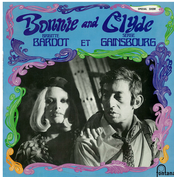
Figure 16 : Pochette de l'album 33 tours Bonnie and Clyde (Gainsbourg 1968b), recto.

single (Gainsbourg 1968b) où le couple Bardot-Gainsbourg, incarnant le gang Barrow, est entouré d'arabesques art nouveau façon « Flower Power » (figure 16).