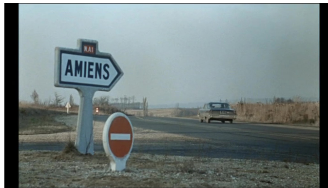
Extrait vidéo 2 : Le Pacha, 0:06:16-0:08:59, © Gaumont.

Cette tension est soutenue par le rythme des images, avec plusieurs mouvements de caméra dramatiques se fixant tour à tour sur un insigne de police, les visages tendus de deux policiers motards, ceux des transporteurs de fonds dans leur fourgon – moteur en marche, prêt à partir –, ceux d’Albert Gouvion puis de son collègue Marc (Jean Gaven). Le montage se veut lui aussi très dynamique, avec des changements de plans souvent calés sur la mesure, conférant à la séquence un côté clip 10 , aspect renforcé par l’absence de dialogues et la rareté des bruits. On notera au passage, pendant la séquence musicale, la discrétion du moteur et surtout des essuie-glaces du fourgon, synchrones avec le tempo – coïncidence ? –, alors qu’ils sont parfaitement audibles ensuite, lorsque Gouvion échange avec le directeur de chez Boucheron (Louis Arbessier). On retrouvera lors des deux moments suivants cet effet de fausse détente, où le retour du son diégétique et plus particulièrement des bruits mécaniques, impassibles, suscite une nouvelle angoisse. Le relâchement de la dynamique sonore