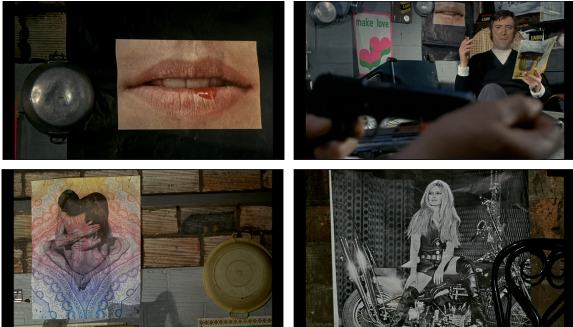
Figures 6-9 : L'univers d'Émile et sa bande (Le Pacha, 01:08:18-01:08:55) © Gaumont.