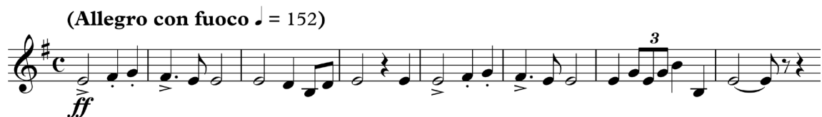
Figure 2 : Thème du finale de la Neuvième Symphonie d'Antonín Dvořák.

Quand Gainsbourg travaille pour un film, la chanson n'est jamais loin. Avec Le Pacha , il n'est nullement question d'utiliser le cinéma comme un laboratoire expérimental ou de recycler certains thèmes 4 . En revanche, le « Requiem » et « Psychasténie » nous renvoient, chacun à sa manière, à une période créatrice bien particulière, celle de Brigitte Bardot, avec laquelle il vit une liaison passionnée. On notera ainsi que la mélodie du « Requiem » emprunte au thème du quatrième mouvement de la Neuvième Symphonie « Du Nouveau Monde » d'Antonín Dvořák (figure 2), quand « Initials B.B. », qui sort en juin 1968, s'inspire du premier mouvement. La parenté thématique est plus immédiate avec l'orgue de « Cadavres en série » (figure 3) qu'avec la ligne vocale, plus libre. De même, le sitar de « Psychasténie » renvoie à la chanson psychédélique « Contact », mais aussi et surtout à « Harley Davidson », qui figure sur la bande originale du film.