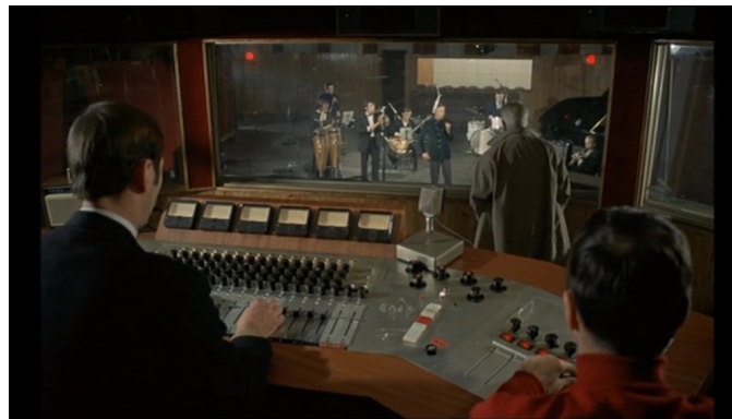
Extrait vidéo 3 : Le Pacha, 00:48:51-00:52:42, © Gaumont.