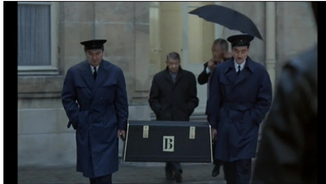
Extrait vidéo 1 : Le Pacha, 0:03:41-0:04:41.