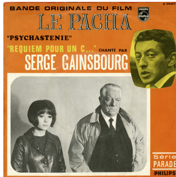
Figure 1 : Pochette du 45 tours Le Pacha (Gainsbourg 1968a), recto.

Lautner, qui tourne pour la première – et dernière – fois avec Jean Gabin, veut sortir l'acteur de son emploi habituel, l'éloigner de son image de commissaire Maigret. Il lui fait endosser le rôle d'un commissaire qui, à la veille de la retraite, est prêt à recourir à des méthodes discutables pour venger son ami. La commission de censure n'appréciera ni le passage à tabac du « Coréen » (Pierre Koulak) ni l'exécution de Marcel Lurat dit « Quinquin » (André Pousse), suivie – et non précédée – d'un tir de sommation. En raison de cette violence, le film sera interdit aux moins de 18 ans lors de sa sortie. Lautner dit de Gainsbourg : « Je crois que le côté moderne, un peu provocateur, du Pacha le branchait bien. [...] Mes démêlés avec le ministère de l'Intérieur faisaient marrer Gainsbourg » (propos rapportés dans Gainsbourg 2015 , p. 11). Réciproquement, il ne fait aucun doute que le réalisateur appréciait le côté caustique de la chanson de Gainsbourg. Conscient des risques, il s'étonne « qu'Alain Poiré, de la Gaumont, qui est plutôt d'éducation bourgeoise, accepte le "Requiem pour un con" pour le générique. Et l'accepte avec enthousiasme, parce que ce n'était pas du tout l'esprit de la maison ! » (Verlant 2000, p. 335). C'était sans compter sur la censure : jugée trop vulgaire, la chanson est interdite sur les ondes radiophoniques et sort sous le titre « Requiem pour un c... » (figure 1).