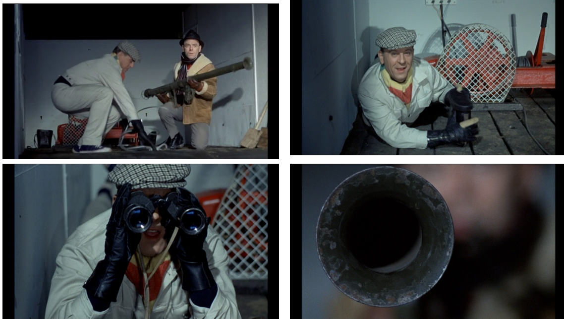
Figures 10-13 : Variations d'échelles de plan au service de la ligne de fuite temporelle (Le Pacha, 00:07:41-00:07:55) © Gaumont.

La caméra revient ensuite sur Quinquin. La batucada reprend pour une troisième et dernière « ligne de fuite temporelle 11 », le crescendo étant soutenu par les éléments du langage filmique, notamment les entrées et mouvements dans le champ, mais aussi le rythme du montage ou les raccords jouant sur différentes échelles de plan (figures 10-13). Contrairement à ce que l'on pourrait attendre, la phrase musicale ne débouche pas sur le tir de bazooka, mais s'arrête brutalement lorsque le convoi est en vue des truands. À nouveau, un bruit de moteur, celui du camion cette fois, prend le relais.