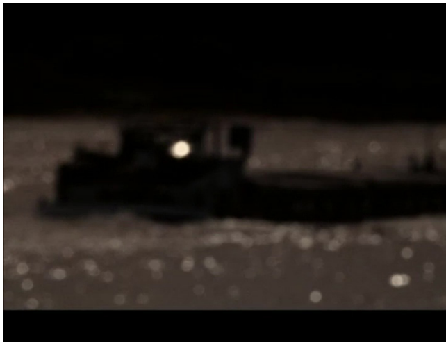
Extrait vidéo 15 : Johan van der Keuken, Vacances prolongées, Derniers feux du jour sur l'Amstel, des barges se retirent, un saxophone s'éteint , 02:15:00-02:17:23