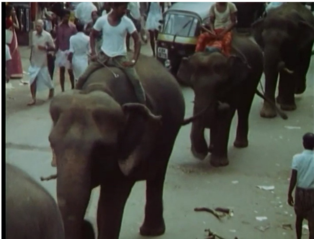
Extrait vidéo 12 : Johan van der Keuken, L'œil au-dessus du puits (1988), Entrent les éléphants, 01:01:10-01:02:14 © Arte France Développement, Idéale Audience International, Pieter van Huystee Film, 2006.