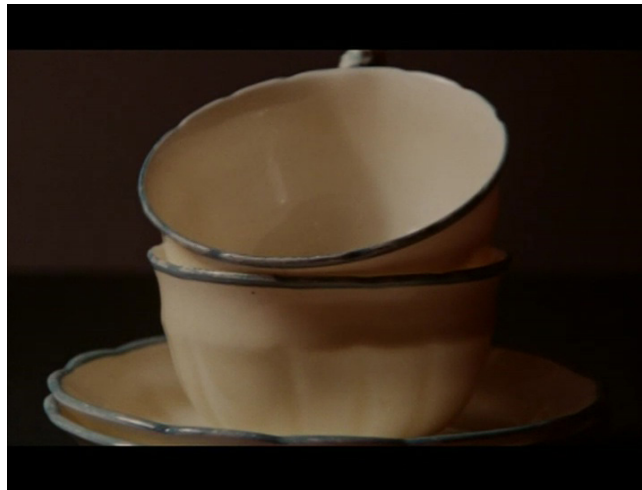
Extrait vidéo 3 : Johan van der Keuken, Vacances prolongées, Tremblement de tasses, 00:00-01:14 © Arte France Développement, Idéale Audience International, Pieter van Huystee Film, 2007.