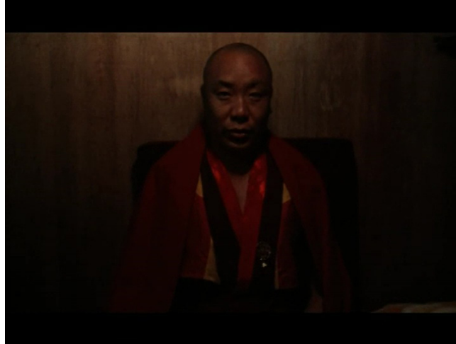
Extrait vidéo 2 : Johan van der Keuken, Vacances prolongées (2000), Continuum des ablutions à la récitation d'un moine bouddhiste, 21:30-22:45 © Arte France Développement, Idéale Audience International, Pieter van Huystee Film, 2007.