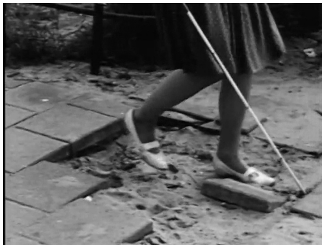
Extrait vidéo 10 : Johan van der Keuken, L'enfant aveugle, Deux jeunes filles aveugles apprennent à se repérer sur un territoire qui les exclut de fait, 19:35-20:51 © Arte France Développement, Idéale Audience International, Pieter van Huystee Film, 2007.