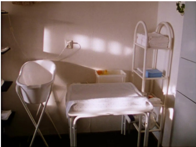
Extrait vidéo 14 : Johan van der Keuken, Amsterdam Global Village (1998), Un bébé naît soudain d'un petit air de flûte, 11:20-12:25 © Arte France Développement, Idéale Audience International, Pieter van Huystee Flm, 2006.

Dans l'appartement de Roberto, le Bolivien d' Amsterdam Global Village , nous avons regardé des films vidéo sur son pays. J'avais alors remarqué le côté très propre, néerlandais, de l'appartement, et tous les objets qui signalaient l'arrivée d'un bébé ; ainsi que quelques éléments qui étaient à lui – la flûte indienne accrochée au mur, par exemple. Je me suis dit qu'il fallait créer une ellipse, et faire arriver le bébé directement dans cet univers. J'ai eu la chance de pouvoir tourner quasiment le même plan de la petite baignoire, avec la même lumière de rêve, mais avec le bébé soudainement présent. C'est une figure de construction propre à la grande tradition du cinéma de fiction, dont j'entrevois la possibilité pendant le tournage. J'étais content de pouvoir poser le film dans cette tradition, et de réussir cette transition des objets à un nouvel être vivant (Van der Keuken 1998, p. 20-21).