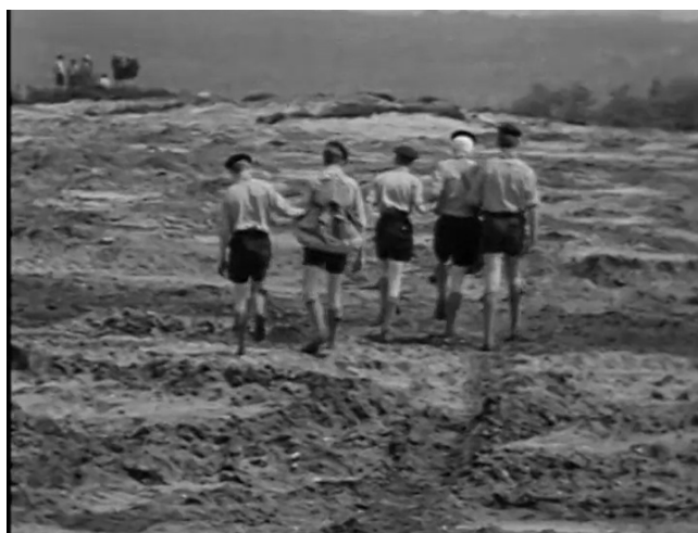
Extrait vidéo 11 : Johan van der Keuken, Herman Slobbe, l'enfant aveugle 2, Scouts toujours, 12:00-13:05 © Arte France Développement, Idéale Audience International, Pieter van Huystee Film, 2007.