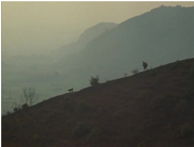
Extrait vidéo 7 : Johan van der Keuken, Cuivres débridés, à la rencontre du swing, « Une musique empruntée puis redonnée à l'existence », 00:00-03:50 © Arte France Développement, Idéale Audience International, Pieter van Huystee Film, 2006.