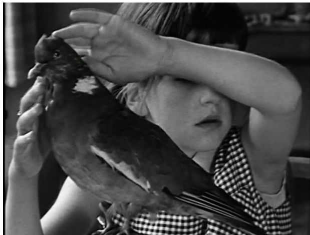
Extrait vidéo 9 : Johan van der Keuken, L'enfant aveugle (1964), Toucher l'oiseau , 07:23-08:04