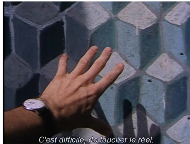
Extrait vidéo 8 : Johan van der Keuken, Vers le sud (1981), « C'est difficile, de toucher le réel », 02:20:32-02:21:28 © Arte France Développement, Idéale Audience International, Pieter van Huystee Film, 2007.

À la fin de Vers le sud , au terme d'un voyage qui l'a mené d'Amsterdam au Caire en passant par plusieurs régions de France et d'Italie, van der Keuken repère une façade d'échoppe dont un pan de mur est couvert d'un motif géométrique peint en trompe-l'œil. Il zoome lentement jusqu'à ce que l'image se confonde totalement avec la peinture et fait ce constat : « De retour dans la ville, je me dis : c'est difficile, de toucher le réel. » À ces mots, sa main entre dans le champ et va effleurer le mur peint (extrait vidéo 8).