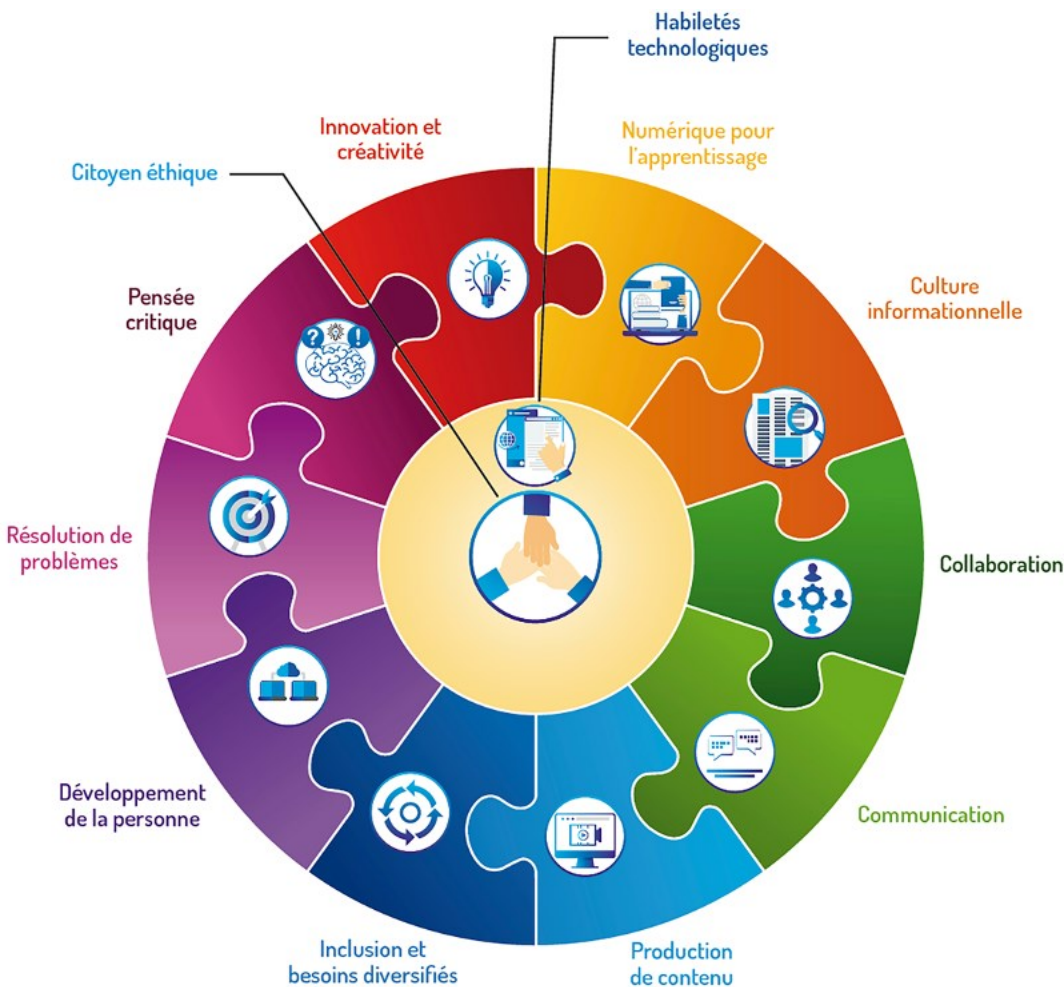
Figure 1 Représentation graphique du Cadre de référence de la compétence numérique

Le Cadre de référence de la compétence numérique a été alimenté par une analyse systématique de plus de 70 référentiels de compétences informationnelles et numériques du 21 e siècle provenant du monde entier. Tout en tirant parti de la richesse des travaux existants, il s'appuie sur une étude des tendances émergentes du numérique en éducation. Par rapport aux documents publiés à l'international, ce projet innove par sa compréhension globale de la compétence numérique. De plus, le choix de concevoir une seule compétence numérique facilite son intégration dans tout autre référentiel ou document se rapportant à l'enseignement et à l'apprentissage. Sur cette base, le Cadre se décline en 12 dimensions phares avec, comme dimensions centrales, Agir en citoyen éthique à l'ère du numérique et Développer et mobiliser ses habiletés technologiques autour desquelles s'articulent les autres dimensions (Figure 1).