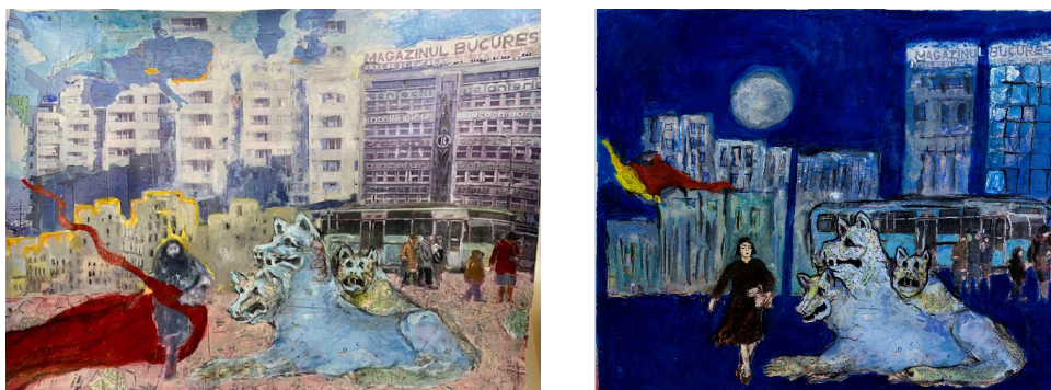
Figure 11 et 12

peut certainement incarner métaphoriquement les méthodes de lavage de cerveau utilisées pour semer la confusion parmi la population captive.