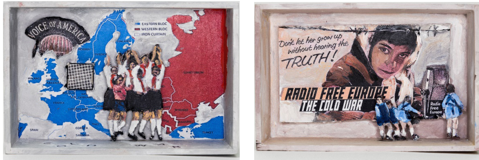
Figure 4 et 5

familiale ou les faits concrets de la vie quotidienne, déjà clairs dans ma mémoire, mais le contexte sociopolitique de l'époque qui demeurait pour moi beaucoup plus confus. Au gré des photos qui me rappelaient cette période, des bribes de souvenirs imprécis ont commencé à émerger. J'en ai réuni quelques fragments dans ce collage intitulé « Bâton de parole » (Fig. 6) : il évoque une épée de Damoclès gardée en suspension dans la main du Conducator , menaçant de s'abattre sur quiconque oserait contester le discours officiel. Bien que celui-ci fasse référence à une réalité parallèle qui ne trompait personne, on ne pouvait l'affirmer à haute voix (Ilea, 2017).