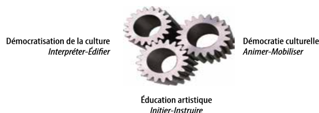
Figure 1. Les trois ressorts des politiques publiques de la culture et leur mode d'intervention correspondant (Lafortune, 2017, p. 35).

(1) Dans une perspective de démocratisation de la culture, la médiation culturelle est liée à des activités d'interprétation et d'édification qui permettent un meilleur accès aux œuvres. On parle également d'actions d'accompagnement des individus dans leur expérience artistique. Appliqué à la présente recherche, ce premier axe de la médiation culturelle réfère à la diversité d'activités réalisées en classe par des médiatrices et médiateurs culturels dans le but d'initier et de préparer les élèves à une œuvre ou à une pratique artistique ou encore de leur faire suite.