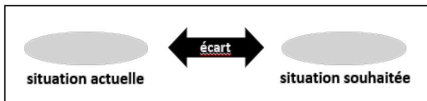
Figure 1 Définition des besoins proposée par Kaufman (1972)

La proposition de Kaufman est grandement utilisée pour définir les besoins des élèves. Or, cette définition couvre également les besoins dans une diversité de domaines. Elle demeure large et non spécifique aux besoins dans un contexte scolaire. Elle offre peu de balises pour cadrer ce qui renvoie aux besoins d'un élève dans un contexte d'éducation inclusive. Ce manque de précision peut mener à une difficulté à identifier les besoins des élèves pour les soutenir efficacement dans leur progression dans leur parcours d'apprentissage tout en évitant les approches déficitaire, catégorielle ou biomédicale.