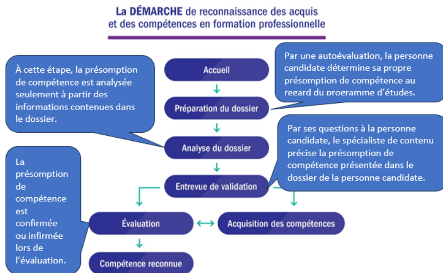
Figure. 2. La démarche de reconnaissance des acquis et des compétences en formation professionnelle 4

L'étape de l'accueil renvoie au choix du programme d'études en lien avec les expériences de la personne candidate. Cette étape se réalise avec l'accompagnement d'une personne conseillère en RAC. La discussion permet de déterminer la pertinence pour la personne candidate de s'engager dans une telle démarche.