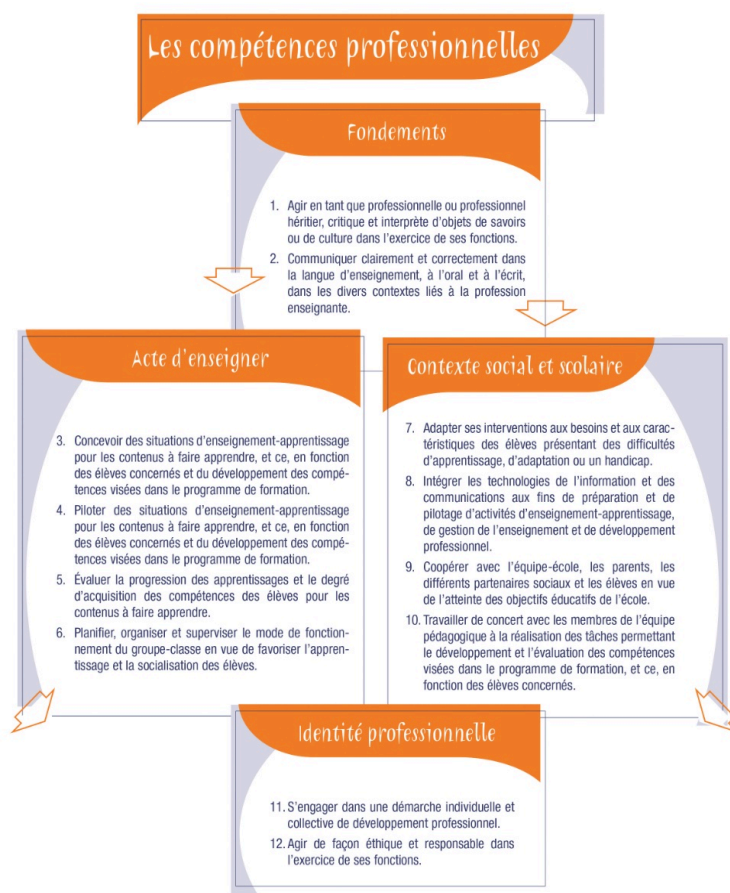
Figure 1 : 12 compétences professionnelles organisées en 4 catégories (MEQ, 2001, p. 59)

La dimension formative de l'évaluation se repère par deux caractéristiques présentes dans une grille. La première caractéristique concerne l'espace accordé aux commentaires dans le document. La deuxième caractéristique correspond aux types de commentaires demandés. Ces caractéristiques témoignent de la prise en compte, d'un point de vue théorique, de la dimension formative par les concepteurs d'une grille d'évaluation en stage.