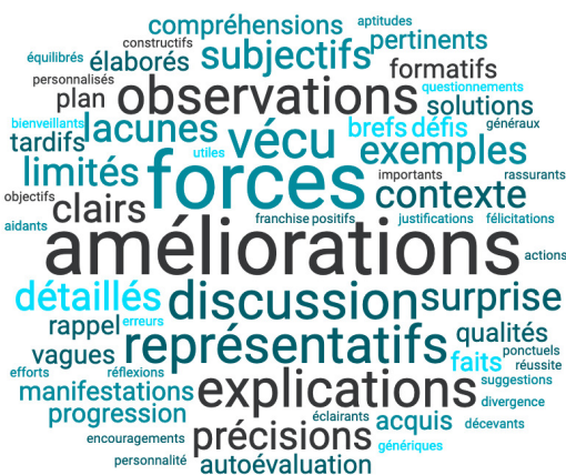
Figure 3 : Synthèse des idées exprimées par les stagiaires liées aux commentaires écrits par les personnes formatrices