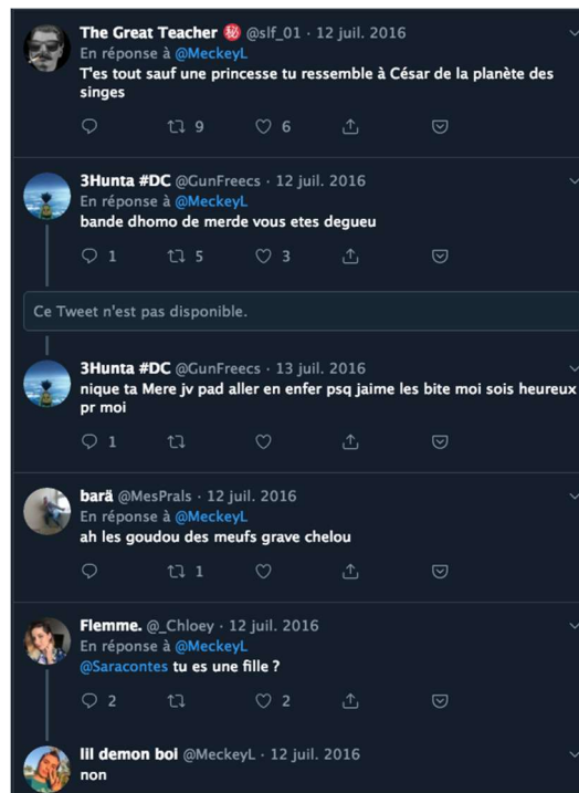
Figure 6 Exemples de réactions négatives à #LesPrincessesOntDesPois

Ces réactions montrent qu'en effet la culture des princesses et le système de domination patriarcal influent sur la perception des jeunes femmes. Cela justifie le besoin de cette nouvelle communauté militante en ligne de « déplacer le curseur », de développer un imaginaire encore inexploré autour de la figure de la princesse, jusqu'à catalyseur d'injonctions, qui intégrerait désormais la réalité du corps, le tout à l'aide d'outils virtuels, mais non pas fictifs pour autant, et permettant des effets bien réels.