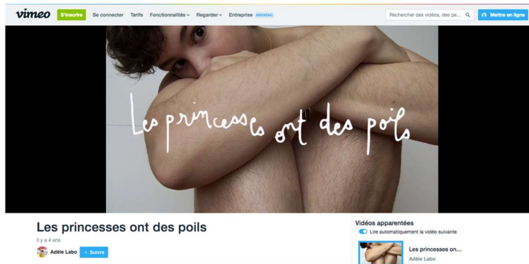
Figure 3 Capture d'écran de la vidéo Les princesses ont des poils d'Adèle Labo, 2015

Tumblr, « Raconte tes poils 30 », créé par la personne à l'initiative du mot-clic, sort dans la foulée, afin de récolter des témoignages d'internautes. #LesPrincessesOntDesPoils connaîtra à nouveau un pic de popularité en janvier-février 2019 31 au moment du défi ( challenge ) #Januhairy, où l'enjeu sera de ne pas s'épiler durant le mois de janvier et d'en rendre compte sur les réseaux sociaux.