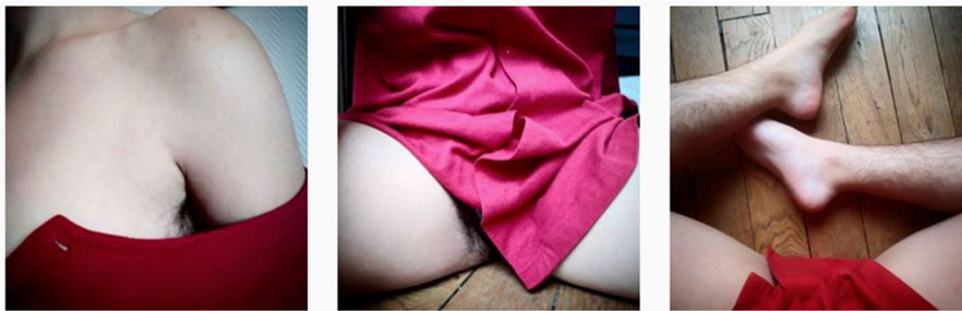
Figure 5 Capture d'écran Instagram

identité devient alors parfois un engagement politique, en affirmant son droit d'apparaître dans un espace public et de montrer un « corps hors normes ». Le cadrage ne s'attache plus uniquement aux formes d'un corps féminin, si nous devons reprendre la théorie du « regard masculin » (Mulvey 1975 : 6-18). Les femmes deviennent sujet, et non plus objet. Ces anonymes se rendent massivement visibles (Gunthert 2018). L'égoportrait étendu (Paveau 2019 35 ), où le corps du sujet est intégré dans l'image sans pour autant montrer de visage, est également de mise (voir figure 5) : le corps entier devient un support identitaire, une interface qui amène à la réaction et à l'échange.