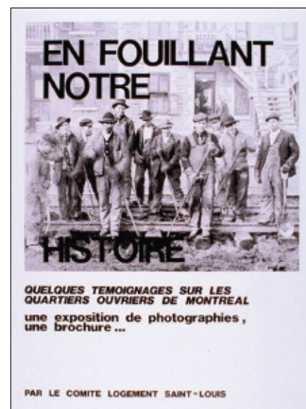
Comité logement Saint-Louis, affiche, 53 x 40,5 cm, 1981

« Il existe une entente tacite entre les générations passées et la nôtre. Sur Terre, nous avons été attendus. »