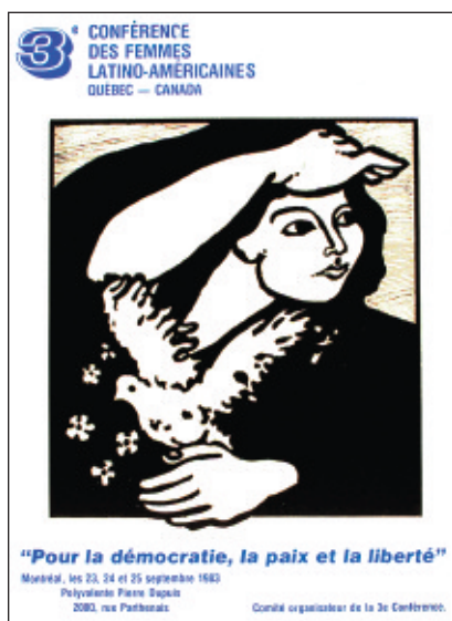
Comité organisateur de la 3 e Conférence des femmes latino-américaines, affiche, 56 x 43 cm, 1983