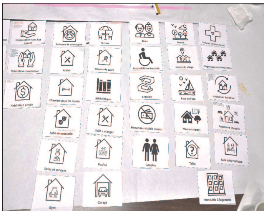
Extrait photo du forum communautaire montrant les choix et les commentaires en lien avec le cadre bâti de l'habitation.

[...] ça doit être central, près de l'église, des magasins du village (Groupe de discussion, femmes âgées de 60 à 70 ans)