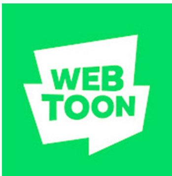
Figure 1. Logo Webtoon Line Naver Corporation.

Composé des mots « web » et « cartoon », la BD coréenne, appelée manhwa au pays du Matin calme serait née au XIX e siècle (Godard, 2016). Le webtoon est un format de lecture dédié aux écrans, particulièrement adapté pour la lecture sur un Smartphone . Conçus spécialement pour être lus de haut en bas c'est-à-dire de façon verticale, en « scrollant » ou en défilant les cases « d'une traite (et non plus découpés en pages) » (Dumeau, 2021), ils ont fait leur apparition en France dès 2011 lors de la création de la maison d'édition pionnière dans ce genre, Delitoon (Delcourt). Après avoir créé en 2004 sa plateforme de BD numériques nommée Webtoon, le conglomérat sud-coréen Naver Corporation, surnommé également le Google coréen, a, dès 2014, conquis les États-Unis et une large partie du marché européen sous le label Line Webtoon. C'est en 2019 qu'il investit le marché français en créant la plateforme Webtoon France avec son traditionnel logo sur un fond vert pomme dont le discours d'escorte est une invitation à la conquête du plus grand nombre: « Line webtoon is for everyone! ».