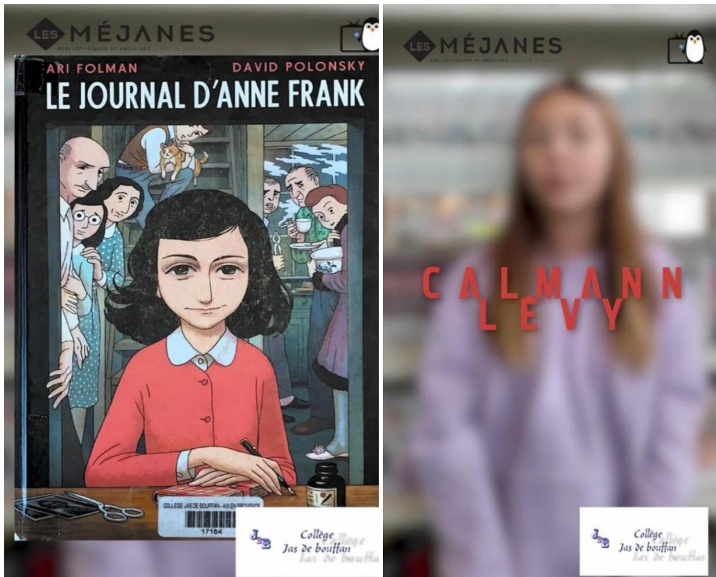
Figure 5. Captures d'écran du projet « À la manière des influenceurs littéraires ».