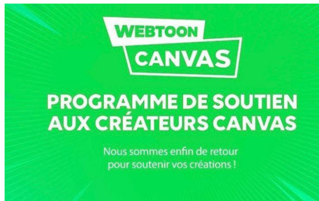
Figure 2. Programme de soutien aux créateurs Canvas Webtoon.