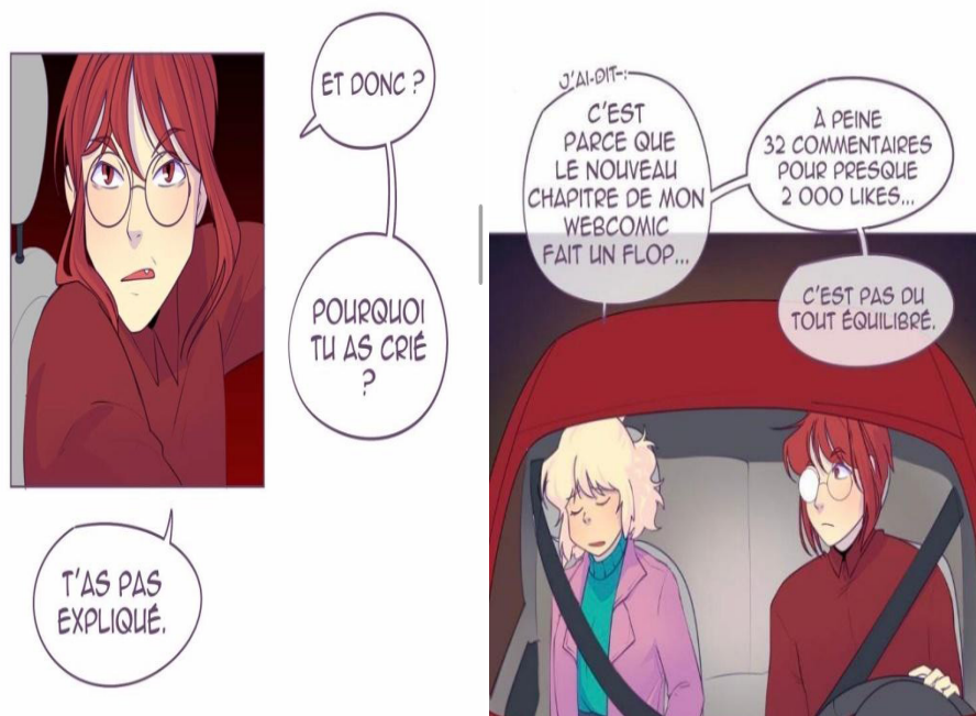
Figure 3. Mon vœu le plus sincère de U. Kiri, Ep. 2.

Cette temporalité scripturale, quasi dystopique, est-elle à mettre en lien avec l'une des caractéristiques de la Hallyu exportée en Occident? Il est vrai que les artistes coréens, comme ceux de la K-pop par exemple, sont soumis à une « surexposition transmédiatique » et se doivent d'être omniprésents pour exister :