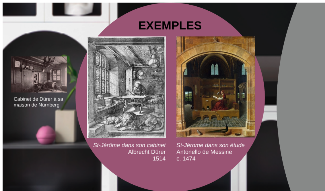
Illustration 2. Extrait de la présentation Prezi Cabinet de curiosité montrant des exemples de l'origine des cabinets

Une deuxième intervention a permis de présenter le concept de curiosité autour duquel le répertoire thématique des élèves était censé se construire. Cette rencontre visait à faire émerger une vision subjective et mouvante de la curiosité, susceptible d'évoluer et de varier en fonction des valeurs du temps et de la culture. Entendue et présentée à la fois comme « l'attitude d'une personne qui désire apprendre des choses nouvelles, rares ou cachées » et comme « la chose curieuse que l'on cherche à appréhender » 19 , la notion de curiosité a été initialement abordée dans sa dimension linguistico-sémantique, interrogée par des listes de synonymes et d'antonymes, et mise en application par la création d'oxymores issus de la combinaison des deux classes de termes. Elle a ensuite été analysée à travers l'œuvre récente de l'artiste Patricia Piccinini, dont les dessins surréalistes et les sculptures de créatures hybrides et anthropomorphes jouent de la labilité des frontières entre formes et émotions propres à l'humain, à l'animal, à la machine et au végétal.