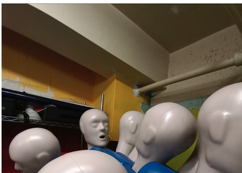
Illustration 3. Photographie numérique sur un coin curieux de l'école, réalisée par un élève

d'appréciation sur le langage photographique a mené les élèves à produire des images ayant pour sujet des coins, des détails et des sons curieux captés à l'intérieur et à l'extérieur de l'établissement scolaire (voir figure 3). Une autre activité visait la mise au carreau d'une image de chaussures, repérée sur Internet et choisie pour son lien avec le thème personnel des élèves (voir figure 4). De plus, des séances sur les arts textiles, liées à la résidence de l'artiste Karine Fournier, ont mené à la fabrication de champignons en façonnage et assemblage, à inclure dans l'installation artistique qui serait exposée en fin d'année.