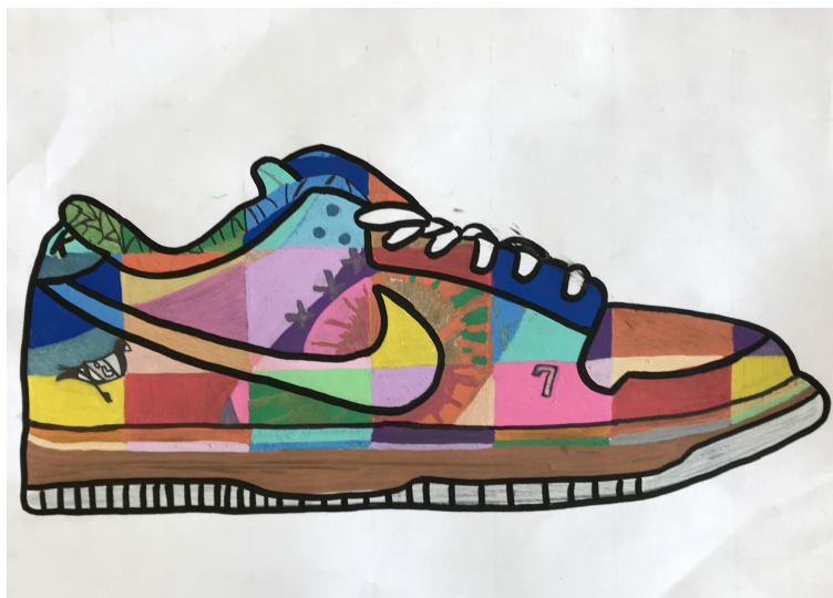
Illustration 7. Remix aux crayons-feutres d'un dessin réalisé à partir d'une image trouvée sur Internet

En parallèle à cette démarche, la cocréation de la séquence et l'observation des pratiques des élèves auraient fait évoluer les représentations de l'enseignante concernant les concepts d'appropriation, d'authenticité et de créativité. Par rapport à l'appropriation, à la fin de la deuxième année du projet, elle se considérait comme plus ouverte et estimait accepter davantage la reprise et l'intégration d'images dans les productions artistiques des élèves. Tout en considérant que les deux pratiques sont sensiblement différentes, elle percevait une certaine proximité entre les procédés de citation ou d'emprunt dans la production littéraire des élèves et la reprise et la modification d'images en contexte artistique. En acceptant la reprise et la manipulation de sources existantes dans une production singulière, elle venait prendre en compte non seulement la production finale, mais également l'ensemble des choix et des démarches de modification effectuées avec une visée artistique :