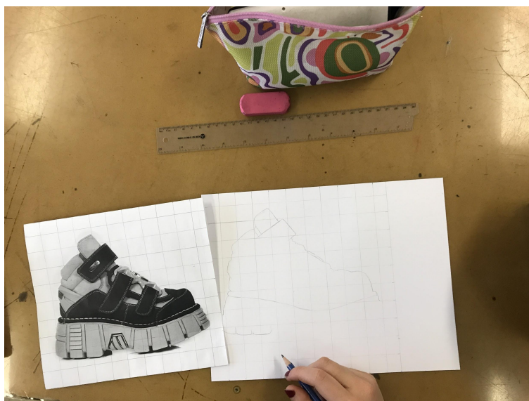
Illustration 4. Exercice de mise au carreau à partir d'une image trouvée sur Internet

Les séances dédiées à la mise en place du cabinet alternaient avec des moments de réflexion de nature conceptuelle, de la recherche d'information et des ateliers de production. Les périodes de réflexion ont permis de présenter la méthodologie de la recherche documentaire (voir figure 5), les stratégies d'identification des ressources et des sources d'inspiration, les principes du droit d'auteur et les licences d'utilisation des contenus repérés sur Internet. Elles ont également permis aux élèves d'identifier des sources et des objets susceptibles de nourrir leur processus de création. La classe a été formée à rechercher, à enregistrer, à classer, à vérifier et à comparer les contenus identifiés, le but étant de sélectionner les ressources « les plus [...] pertinentes par rapport au sujet et aux intentions de création » 20 .