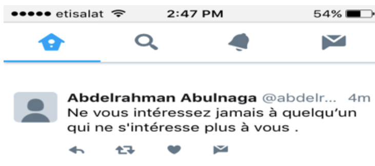
Illustration 3. Exemple de tweet littéraire (apprenant de niveau B1)

À titre d'exemple, les poèmes animés que les étudiants ont créés ont d'abord été composés en forme de texte, puis transformés en images animées à l'aide d'un logiciel en ligne et enfin partagés sur le Wiki en forme de GIF. Les tweets littéraires étaient également rédigés d'abord sur le Wiki, puis révisés par les pairs avant d'être publiés sur Twitter avant d'être postés sur le Wiki (voir illustrations 3 et 4).