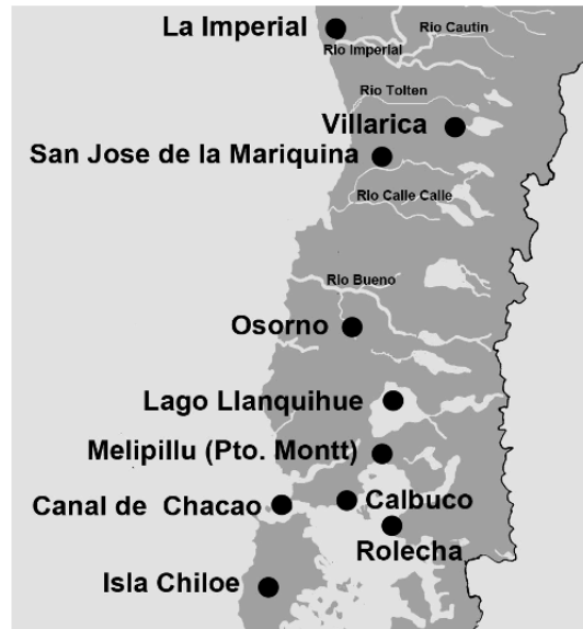
Figura 3. Recorrido de la expedición desde La Imperial a Chiloé.