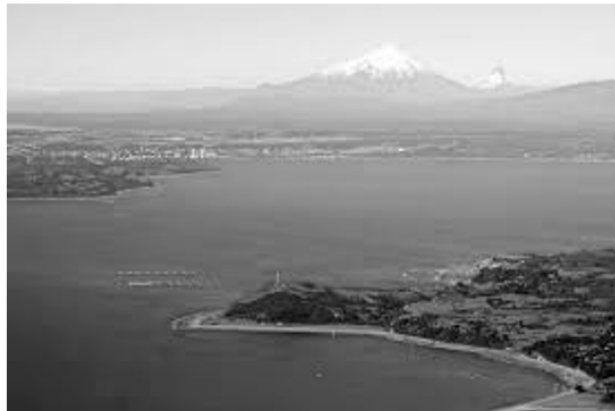
Figura 4. Vista desde lo alto de Isla Maillen, frente a Melipillu: Seno Reloncaví, golfo de Ancud y Volcán Calbuco febrero 1558 (archivo personal, foto 2019).