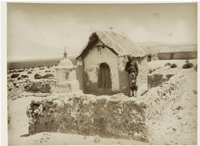
Figure 4 Amincha en 1890