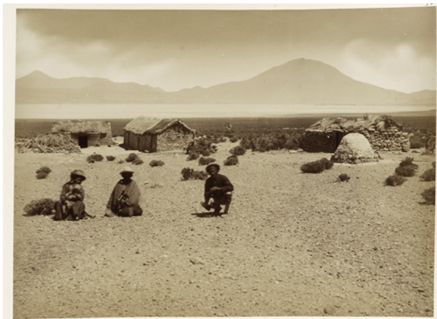
Figure 7 Salar de Carcote en 1890

dispersés dans les lieux de pâturage que les communautés de l'Altiplano utilisaient grâce à l'eau des vegas (plaines ou vallées fertiles) qui se forment dans les ravins des volcans de la région. Ces images montrent également les mécanismes visuels utilisés par le photographe pour, par le biais du portrait, transformer et participer à la création de modèles représentatifs d'une ethnie : « les indigènes représentés dans la porte de leur maison sont totalement visibles sous un environnement esthétique clairement associé au désert – architecture et paysage – et par leurs costumes ethniques de manteaux et de chapeaux » (Alvarado 2016 : 26). Pour Alvarado, la composition de l'image qui place les sujets au centre, ainsi que leur pose, révèle l'intention du photographe d'enregistrer et de documenter une réalité culturelle différente. Ce que l'auteure appelle un « imaginaire de frontière » (Alvarado 2016) se construit sous une tension constante entre visibilité/invisibilité et absence/présence des sujets autochtones andins.