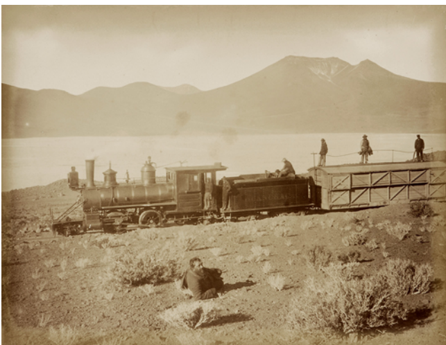
Figure 10 Chemin de fer Antofagasta-Bolivie en 1890

l'étude des cadres tant domestiques que d'exposition, l'ethnographie des pratiques photographiques dans de nombreuses régions du monde. (Edwards et Hart 2004a : 14)