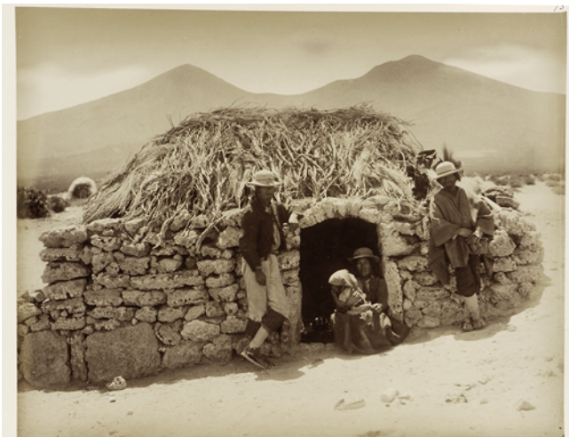
Figure 5 Amincha en 1890 (Photo des frères Lassen. Collection du Museo Histórico Nacional de Santiago, AF-0140-73)