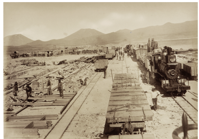
Figure 2 Construction de la gare d'Ollagüe en 1890 (Photo des frères Lassen. Collection du Museo Histórico Nacional de Santiago, AF-0140-70)

nouveau lieu de travail et en laisse, en général, une bonne partie à sa famille qui reste au village. L'avance est ensuite déduite du salaire qui, au bout du compte, n'est plus suffisant pour couvrir les besoins quotidiens du travailleur. Celui-ci s'endette alors auprès de son employeur et est contraint de rester plus de temps que prévu loin de son village. (Salazar-Soler 2002 : 79)