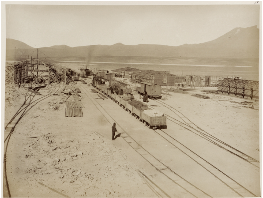
Figure 1 Construction de la gare d'Ollagüe en 1890

La mine fait savoir à l' enganchador le nombre d'ouvriers dont elle a besoin pour une période de temps déterminée ou pour réaliser une tâche spécifique; l' enganchador charge un subalterne de prospecter et de localiser d'éventuels travailleurs. L' enganchador signe ensuite avec le paysan recruté un contrat de travail, avec la caution d'une ou deux autres personnes du village qui s'engagent à remplacer le travailleur embauché en cas de défection. Le paysan recruté perçoit au moment de la signature du contrat, dans sa communauté d'origine, une avance sur ses futurs salaires. Il utilise une partie de cette avance pour financer son voyage jusqu'à son