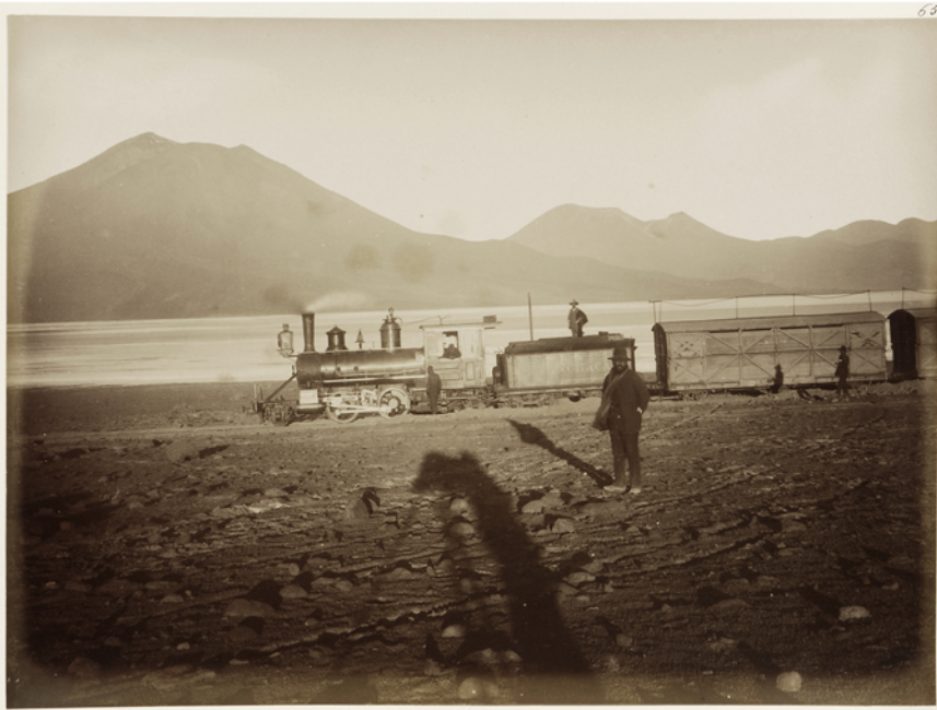
Figure 9 Chemin de fer Antofagasta-Bolivie en 1890 (Photo des frères Lassen. Collection du Museo Histórico Nacional de Santiago, AF-0140-65)