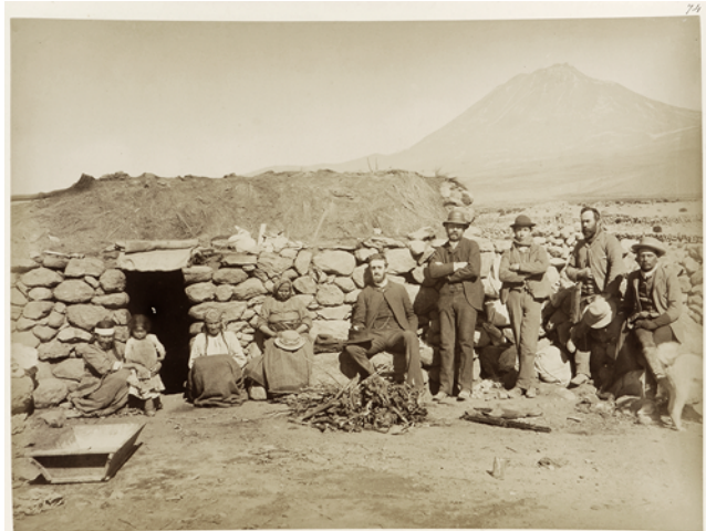
Figure 6 Amincha en 1890