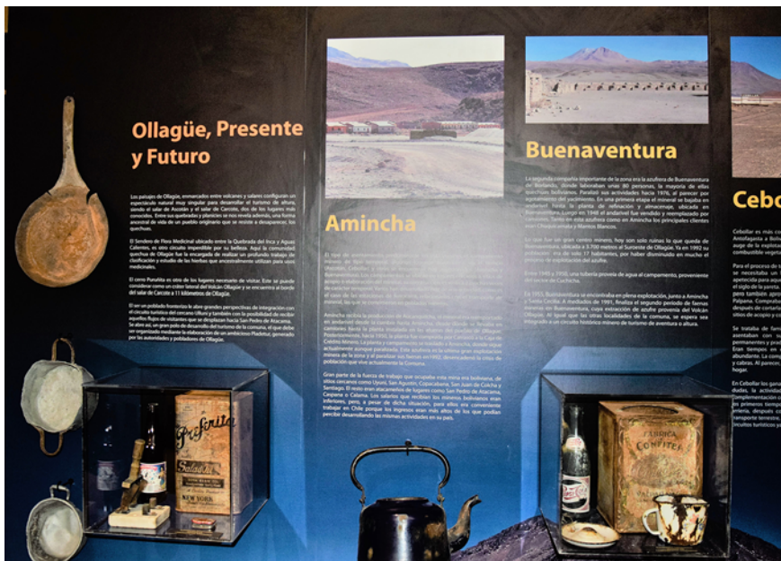
Figure 11 Exposition dans le Museo Antropológico Leandro Bravo Valdebenito d'Ollagüe

processus de construction du passé par le biais de la patrimonialisation des objets, des images et des souvenirs d'une époque très récente, ainsi que le rôle de la pratique archéologique dans ce processus. En ce sens, un deuxième aspect intéressant de cet exercice de réflexion par rapport aux photographies est associé à un autre grand paradoxe que comporte la construction du passé : le passé lui-même n'est pas représentable, mais décousu et impossible à revivre et à circonscrire. La politique patrimoniale et les pratiques de mémoire impliquent toujours l'intention d'évoquer le vécu et, principalement, de le faire d'une manière cohérente. Cette mission se complique, tant nous sommes proches et reliés au passé récent. L'histoire de l'exploitation du soufre à Ollagüe se situe à une extrémité de la temporalité. En raison de sa proximité avec le présent, le soufre d'Ollagüe n'est pas encore assez éloigné pour être ciblé dans un discours sur « le passé ».