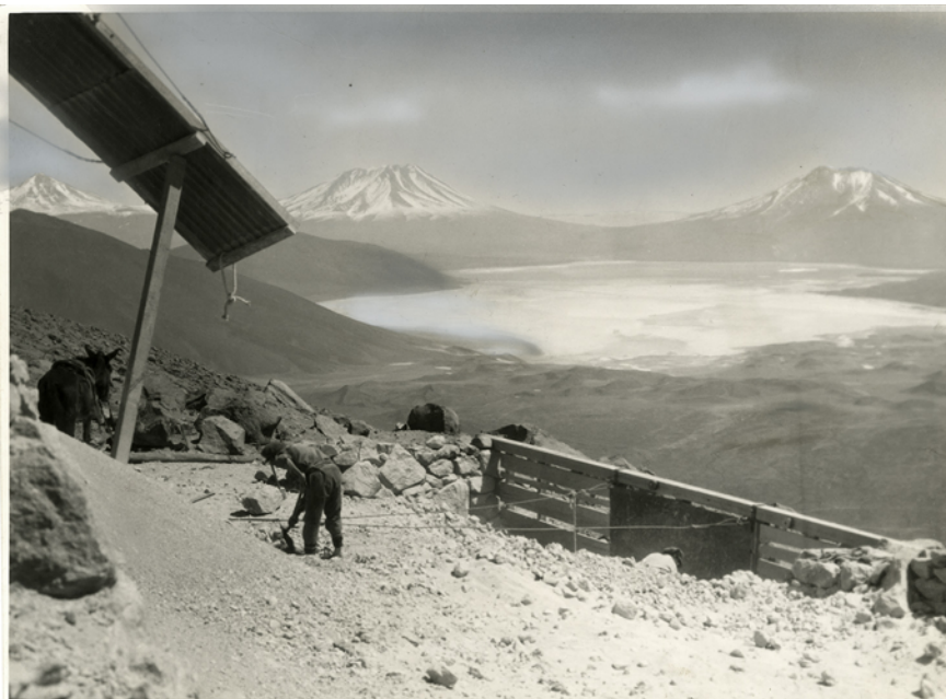
Figure 8 Exploitation de soufre sur le volcan Ollagüe en 1945 (Photo de Robert Gerstmann. Collection du Museo Histórico Nacional de Santiago, FC-005770)

Les images de paysages et de coutumes révélant une vision artistique, sociale ou anthropologique furent