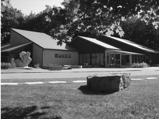
La Pointe-du-Buisson / Musée québécois d'archéologie, 2011