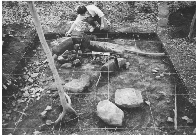
Aire de fouille avec quadrillage sur la station 4 de Pointe-du-Buisson, saison 1968