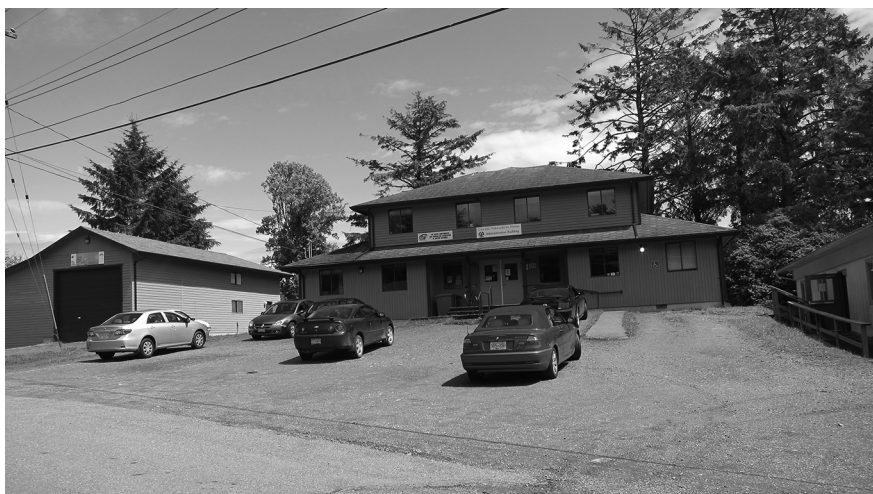
Figure 3 Centre administratif de la réserve (Photo de Marie Mauzé, juillet 2011)

conditions décentes. La relocalisation s'est faite dans la précipitation la plus désorganisée. Aucune consultation n'a été entreprise avec les chefs des deux communautés pour décider des différentes étapes de la réinstallation au vu de l'avancement des travaux de construction des maisons. À la suite des recommandations de l'agent J. A. Findlay, il a été proposé de construire huit maisons pour les 'Nakwaxda'xw, puis seize l'année suivante pour les Gwa'salas, compte tenu du fait que les deux bandes avaient donné leur accord pour la réinstallation à Tsulquate, « à condition que tous les membres puissent déménager en même temps » (Kwakwewlth Agency Agent J.A. Findlay, Letter to Indian Commissioner, B.C., J.V. Boys, Feb. 23, 1963 (INAC 1951-73, various files, cité in Emery et Grainger 1994 : 84). En tout état de cause, la construction d'une vingtaine de logements était nécessaire pour accueillir l'ensemble des habitants de Ba'a's et de Takush, et cela devait s'échelonner sur une période de trois ou quatre années (Emery et Grainger, ibid. ).