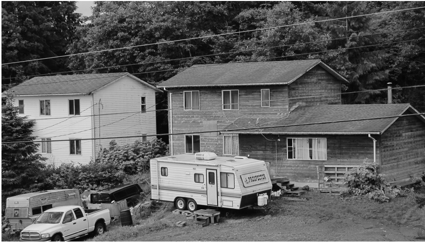
Figure 4 Maisons en face du centre administratif de la réserve (Photo de Marie Mauzé, juillet 2011)

presque 20 dans une maison de trois pièces. Quelques mois après, on a eu notre maison. Il a fallu faire la peinture. On n'avait pas de salle de bain, pas d'eau courante. (Janet Paul, entretien, 22 juillet 2011)