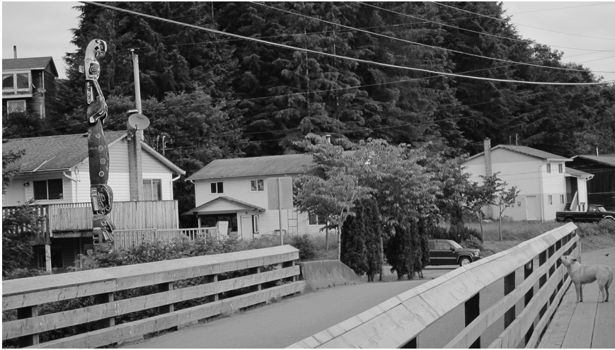
Figure 2 Pont menant à la réserve de Tsulquate (Photo de Marie Mauzé, juillet 2011)

l'amalgame. En 1964, les trois bandes ont fusionné pour former la bande kwakwewlth. Au vu des documents, le projet de délocalisation et de fusion des bandes était celui du Commissaire Boys, plus que celui de l'agent local et du Ministère à Ottawa. En effet, Boys reçoit l'accord d'Ottawa en décembre 1964, c'est-à-dire quelques mois après la relocalisation (Emery et Grainger 1994 : 43, 45).