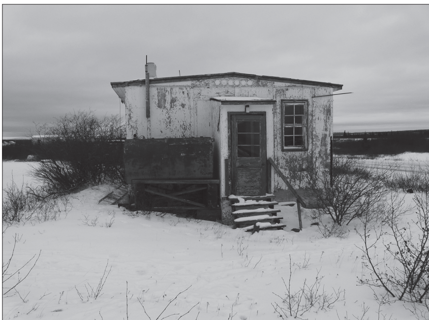
Figure 6 Bâtiment obsolète du McGill Subarctic Research Laboratory, Schefferville (Photo Jean-Sébastien Boutet, novembre 2008)

les filets. Il n'y avait plus de poissons, les lacs étaient vides. Il y avait tellement de monde au lac Attikamagen que le poisson a disparu. ( ibid. : I-29b)