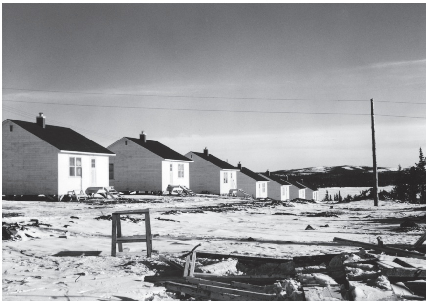
Figure 3 Maisons naskapiées bâties par les autorités fédérales pour loger les gens de Fort-Chimo et de Fort Mckenzie déménagés à Schefferville