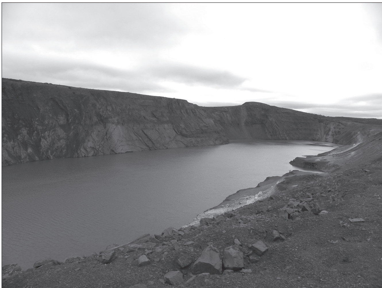
Figure 5 Ancienne mine située à quelques kilomètres au nord-ouest de Schefferville (Photo Jean-Sébastien Boutet, septembre 2009)

individus disponibles pour le travail – s’y occupèrent pour une partie de l’été (Désy 1963 : 64 ; Thorn 1969 : 24). Rappelons de plus le caractère éphémère de ce labeur : lorsque la IOC renvoya subitement la majorité de son effectif innu-naskapi au mois d’août de ce même été 1962 (voir ci-haut), le taux d’emploi autochtone à la Compagnie, d’apparence élevé puisqu’il oscillait autour de soixante pourcent, plongea soudainement à moins de vingt. En même temps que ces communautés devinrent de plus en plus dépendantes des salaires pour subvenir à leurs besoins à Schefferville, il leur fut en général difficile d’obtenir un travail stable et satisfaisant. En conséquence, non seulement l’aide gouvernementale resta significative pendant la période de production minière – elle représenta environ un tiers des revenus de la communauté naskapie entre 1965 et 1966, à un moment où l’emploi fut relativement élevé (Robbins 1969 : 124) –, mais également, même d’un point de vue strictement