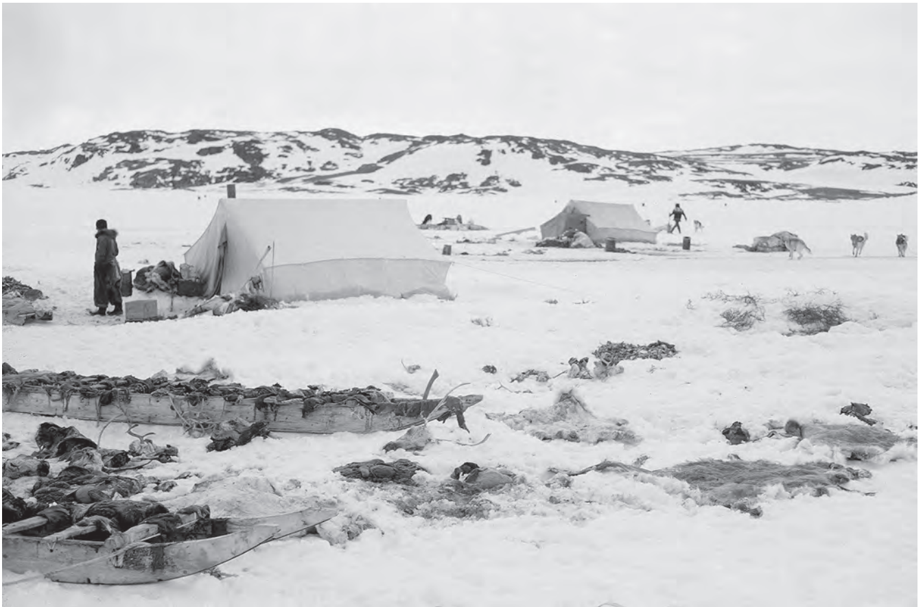
Retour de la chasse au caribou