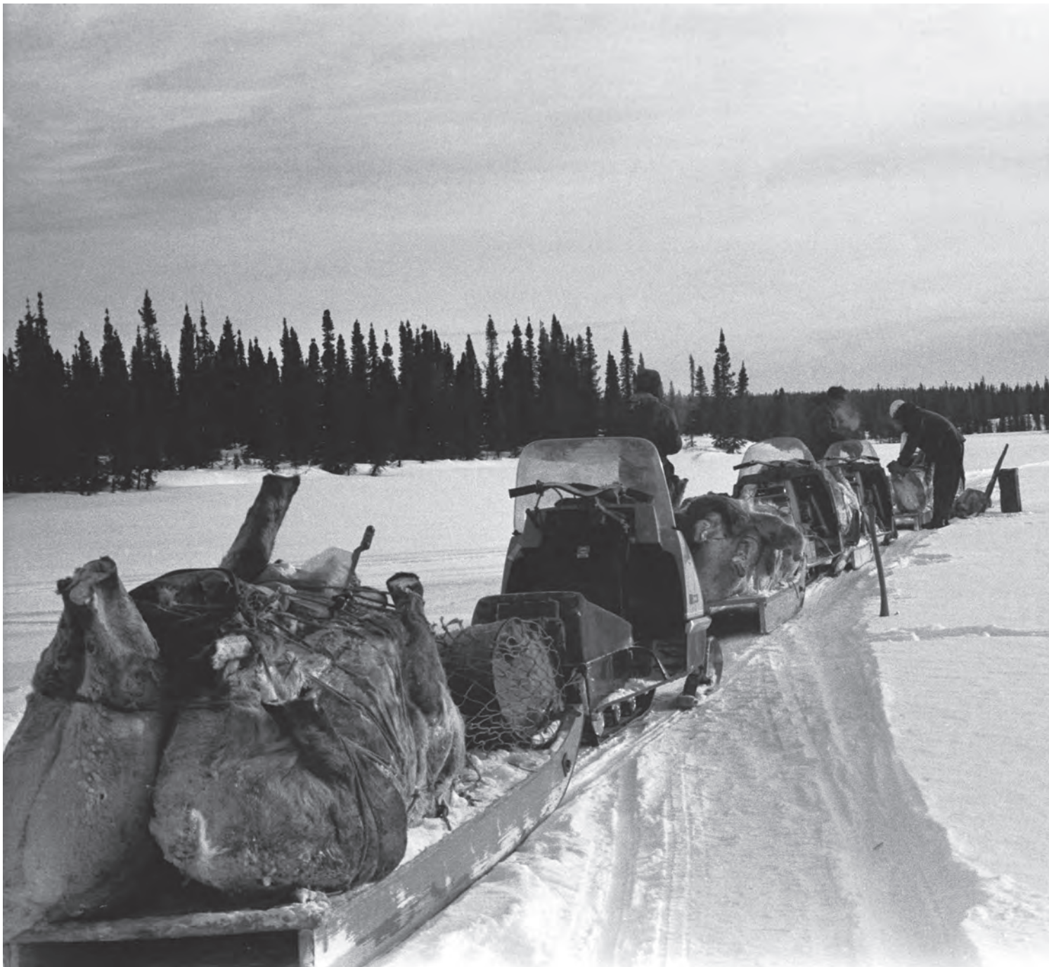
Chasse au caribou, hiver 1971