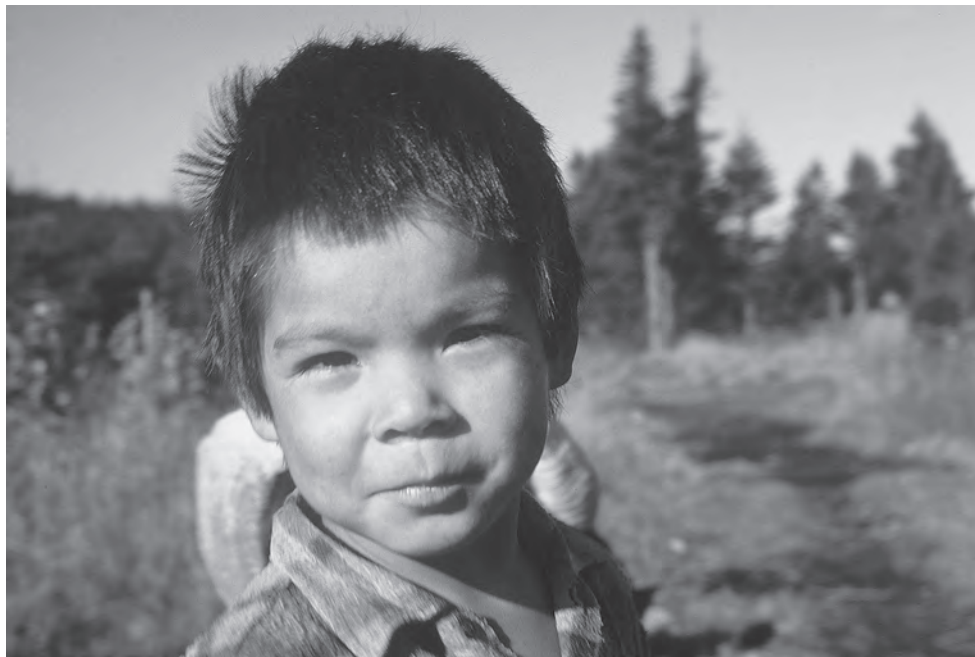
Un enfant d'Unaman-shipit, automne 1970