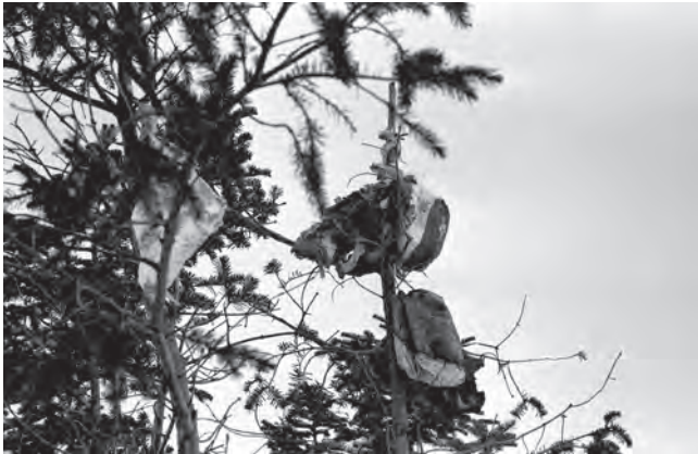
Restes d'un animal terrestre accrochés en offrande dans un arbre, hiver 1971