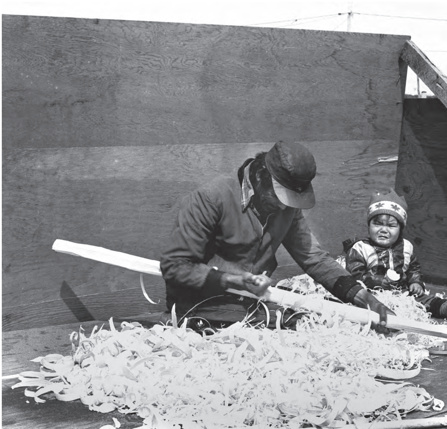
Fabrication d'une rame à l'aide d'un couteau croche

(PHOTOS : RÉMI SAVARD; RESTAURATION : FRANÇOIS LÉGER-SAVARD)