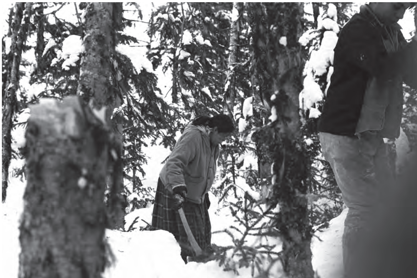
Une femme cherchant du bois de chauffage, hiver 1971