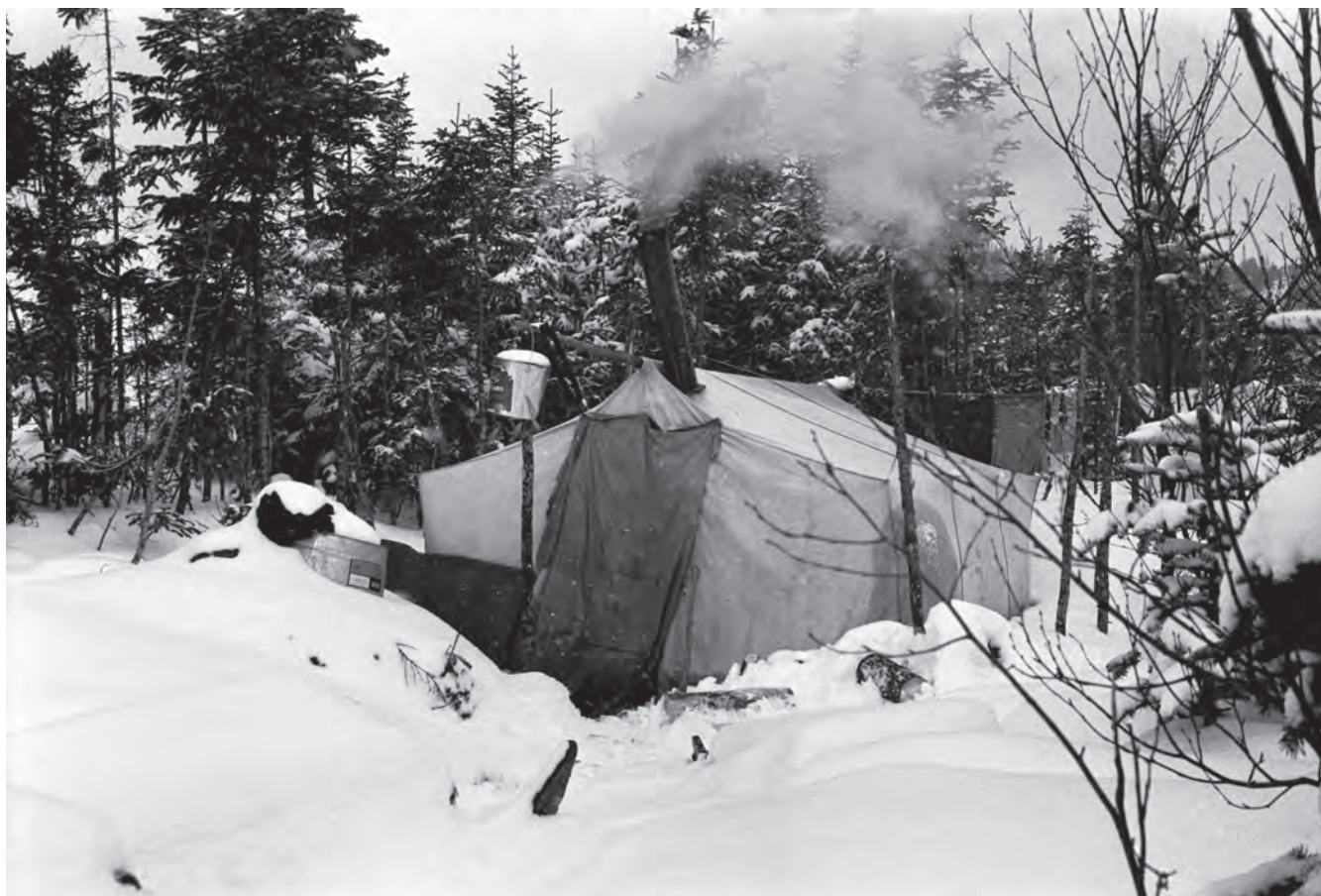
L'une des seize maisons du village, hiver 1971