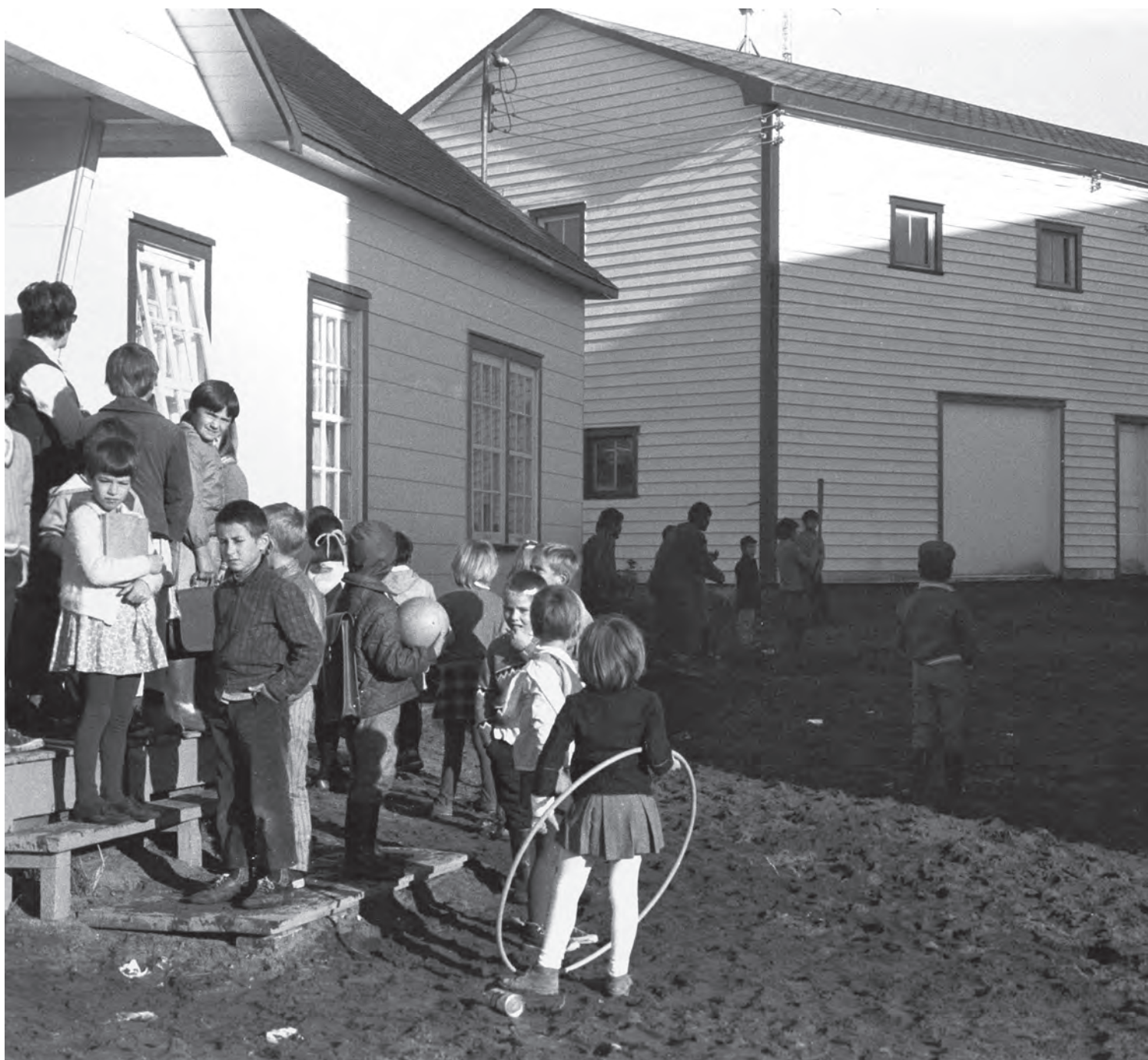
L'école (au village des Blancs), Saint-Augustin, automne 1970