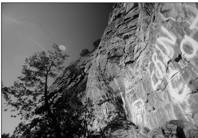
Figure 7 Exemple de parois aux dessins rupestres couvertes de graffiti au site du Rocher à l'Oiseau, rivière des Outaouais. Avec le temps, ces graffiti constituent des témoignages auxquels peuvent se greffer des récits individuels ou collectifs. On peut s'interroger pour savoir s'il ne serait pas souhaitable de conserver sur ce site l'intégrité de telles œuvres modernes, dont certaines ont déjà plus de cinquante ans, sauf aux endroits où se trouvent des peintures de facture algonquienne ? Pour les autochtones, ces graffiti constituent pourtant des actes de profanation du site. D'où l'importance d'un dialogue entre les groupes d'intérêts concernés par l'avenir du site

Jack (forme anglicisée de Wiske'djack ), entité majeure de la cosmologie algonquienne. Mais qu'en est-il de cette dimension immatérielle et de la valeur sacrée du rocher à l'Oiseau près d'un siècle plus tard, alors que le site est désormais affligé de si nombreux graffiti ?