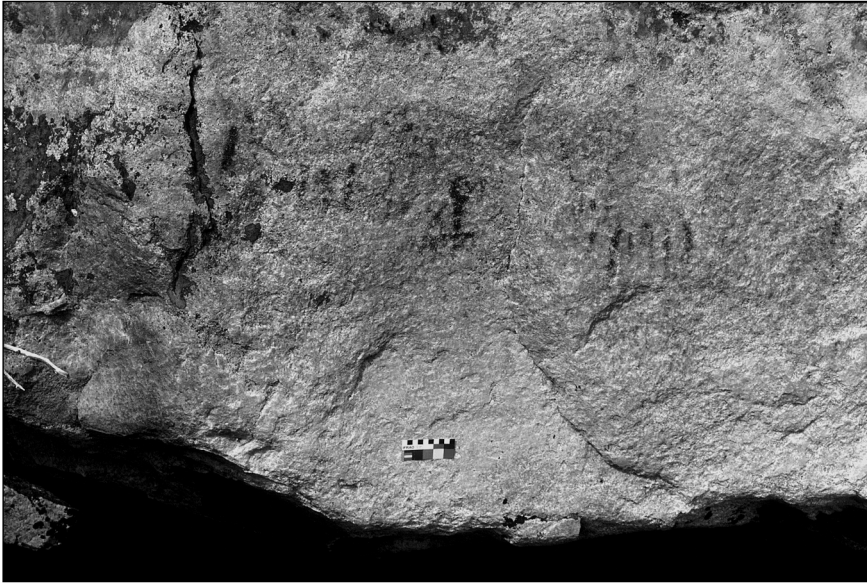
Figure 5 Le panneau principal du site Kaapepeschapissinicanuuch , lac Némiscau, Jamésie. Ce panneau se trouve au-dessus d'une ouverture vers l'intérieur du rocher, un passage qui, selon les renseignements obtenus de la part d'ainés cris, était emprunté par les memegwesho , intercesseurs entre les chamanes et les êtres du monde suprasensible

kilomètres de là. Ainsi, mes informateurs présentaient le site rupestre comme ayant été jadis un lieu fort singulier dans le paysage sacré cri, car le rocher était autrefois occupé par les memegwesho , de petits êtres velus qui, selon des traditions orales algonquiennes (cf. Flannery 1931), habitaient l'intérieur des formations rocheuses et agissaient comme intermédiaires entre les humains et les esprits pour transmettre des connaissances sacrées ou même des pouvoirs surnaturels aux chamanes venus les visiter. Or, le nom traditionnel que ces aînés cris attribuent au site de Némiscau est pour le moins surprenant : Kaapepeschapissinicanuuch . On notera que c'est un nom fort semblable à celui que l'on retrouvait dans les cartes du Père Pierre-Michel Laure, dessinées quelque 250 ans plus tôt, pour désigner le site Nisula. On a donc ici une désignation très similaire à l'endroit de deux sites rupestres distincts, qui renvoie de manière étonnante à un univers de sens partagé par deux groupes culturels apparentés mais distants dans le temps et l'espace.