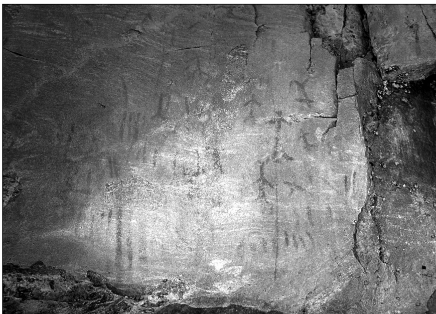
Figure 3 Le site Nisula (détail du panneau principal), daté de plus de 2 000 ans, qui se trouve sur la Côte-Nord, au Québec, constitue un exemple bien conservé de sites rupestres algonquiens dans le Bouclier canadien

Ce deuxième exemple concerne un site aux dessins rupestres ocrés se trouvant en Jamésie, au cœur du territoire cri, dans une zone sous plein contrôle de l'administration régionale cri. C'est à la demande expresse d'ainés cris que je fus invité à faire l'étude du site à la fin des années 1990 (cf. Arsenault 1998b, 1999 ; Vaillancourt 2003). Le site possède une série de motifs pour la plupart géométriques étalés sur les parties basses d'un rocher en forme de dôme. Les quelques