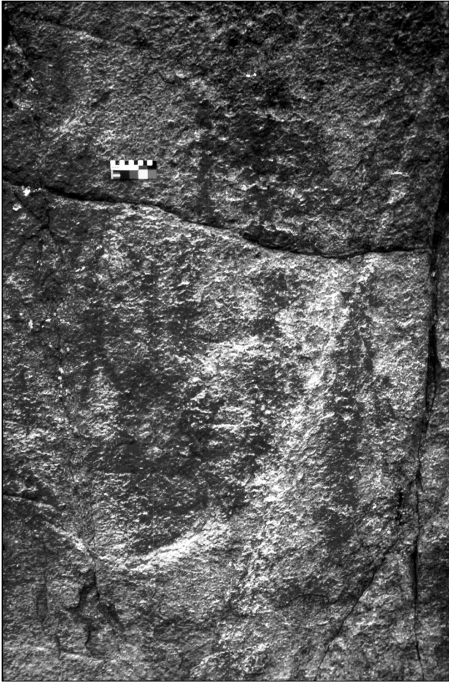
Figure 2 Trois personnages aux oreilles de lapin ou à tête cornue sont visibles dans la partie supérieure, l'un au centre au-dessus de la fissure horizontale, les deux autres à gauche sous la même fissure, au site Manitou, en Outaouais

renvoyant à un signifié connu. En revanche, on constate parfois la présence de motifs identifiables, lesquels illustrent soit des objets de la culture matérielle (tels des canots ou des armes), soit des figures anthropomorphes ou zoomorphes. À noter que dans ces derniers cas, bien qu'ils soient schématiquement dépeints, les personnages peuvent aussi combiner des traits humains et animaux leur conférant ainsi un aspect fantasmagique : de tels figurants représentent selon toute évidence des êtres hybrides et seraient ainsi l'illustration de membres appartenant au monde surnaturel et à la cosmologie algonquienne. Tel est le cas, par exemple, de la figure anthropomorphe portant de longues oreilles de lapin sur la tête, identifiée à Nanabozho, héros civilisateur algonquien, de l'oiseau-tonnerre, du serpent à tête cornue, ou encore d'un personnage d'apparence humaine affublé de cornes de bison que l'on associe généralement à un chamane ou à un être investi d'un pouvoir surnaturel (fig. 2).