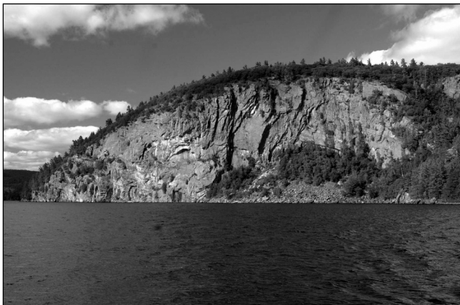
Figure 6 Exemple de falaise ornée où l'on peut retrouver aujourd'hui des peintures rupestres, site du Rocher à l'Oiseau, rivière des Outaouais