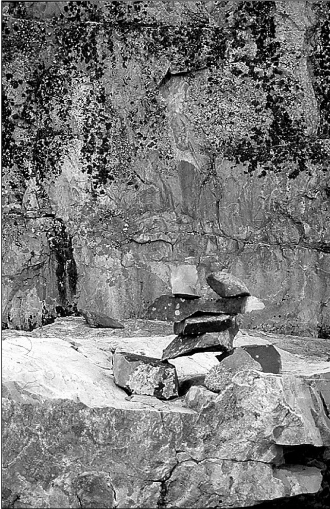
Figure 8 Un marqueur en forme d'inukshuk laissé en 2002 par des visiteurs anishinabes sur un site rupestre de l'Abitibi afin de faciliter le repérage du lieu ainsi réapproprié. Le panneau orné principal se trouve directement dans l'axe de ce petit amoncellement de pierres

Deuxièmement, un site rupestre peut être récupéré à des fins politiques et en tant que preuve concrète de la présence amérindienne plusieurs fois centenaire dans une région donnée, être utilisé comme instrument de revendications efficace et, par conséquent, comme enjeu pertinent au sein des discussions entre représentants politiques pour la reconnaissance d'un territoire dit traditionnel. Le cas du site Nisula est sans doute le plus éloquent à ce chapitre.