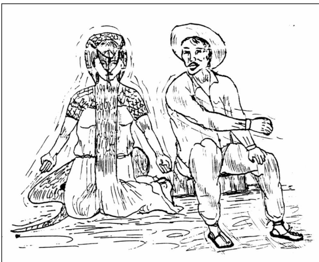
« Quand l'amant s'approcha, elle redevint serpent. » (Source : Taller de Tradición Oral del CEPEC et Beaucauge 1998 : 202)