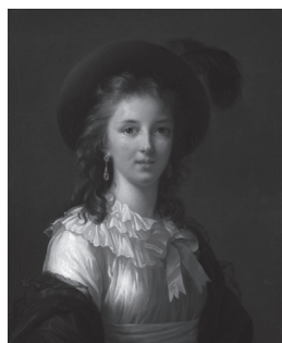
Élisabeth Louise Vigée Le Brun, Autoportrait , v. 1781. Huile sur toile, 64,8 × 54 cm. Kimbell Art Museum, Fort Worth, Texas (ACK 1949.02).*

chatoyants, les modèles d'Élisabeth Louise Vigée Le Brun (1755–1842) ont fait les yeux doux aux visiteurs du Musée des beaux-arts du Canada qui présentait, du 10 juin au 11 septembre 2016, l'exposition Élisabeth Louise Vigée Le Brun (1755–1842), La portraitiste de Marie-Antoinette . Les portraits rassemblés constituaient une fabuleuse galerie de personnalités des XVIII e et XIX e siècles qui s'offraient au public comme autant de témoins du talent d'exception de la portraitiste et de sa longue carrière au sein des prestigieuses cours d'Europe. Le commissaire principal de l'événement, Joseph Baillio, spécialiste reconnu de la peinture de Vigée Le Brun à laquelle il se consacre depuis près de cinquante ans, prépare aujourd'hui le catalogue raisonné de son œuvre complet. La postérité tranquille de l'une des plus grandes peintres de son temps méritait d'être enrichie à plus d'un égard, d'autant qu'il s'agissait de la première rétrospective d'envergure qu'une institution muséale lui consacrait. 1 Organisée de concert par la Réunion des musées nationaux (Grand Palais à Paris), le Metropolitan Museum of Art de New York et le Musée des beaux-arts du Canada, secondée par le concours exceptionnel du Musée national des châteaux de Versailles et de Trianon, l'exposition s'imposait comme une réhabilitation essentielle de l'œuvre colossal de Vigée Le Brun.