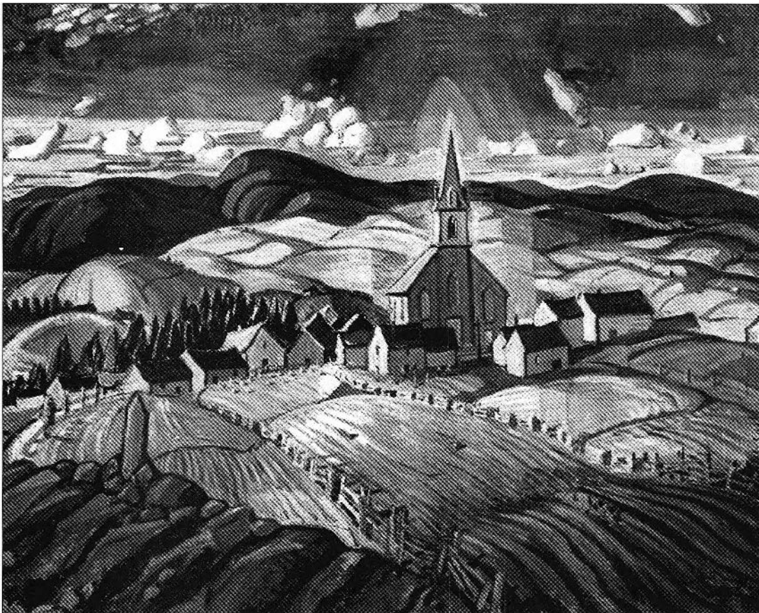
Figure 4. Arthur Lismer (1889-1965), Quebec Village, 1926, huile sur toile, 132 x 163 cm.

on a glowing August afternoon, had suddenly felt time stand still. The painting carried into it much of the essential religion and profound love of home which counter-balanced in the complex nature of its artist, his rebellious iconoclasm and his urbane universality of feeling. 36