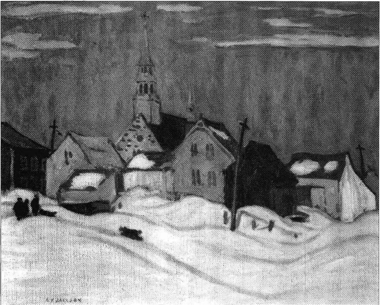
Figure 1. A. Y. Jackson, A Quebec Village (Cacouna) , 1921, huile sur toile, 21 1/4 x 26 po., s.b.g. : «A Y JACKSON» (crédit photographique: Musée des beaux arts du Canada, Ottawa, cat. n° 1812).

preservation and reconstruction in modern society. The separation of non-modern culture traits from their original contexts and their distribution as modern playthings are evident in the various social movement toward naturalism, so much a feature of modern societies : cult of folk music and medicine, adornment and behavior, peasant dress, Early American decor, efforts, in short, to museumize the premodern 12 .