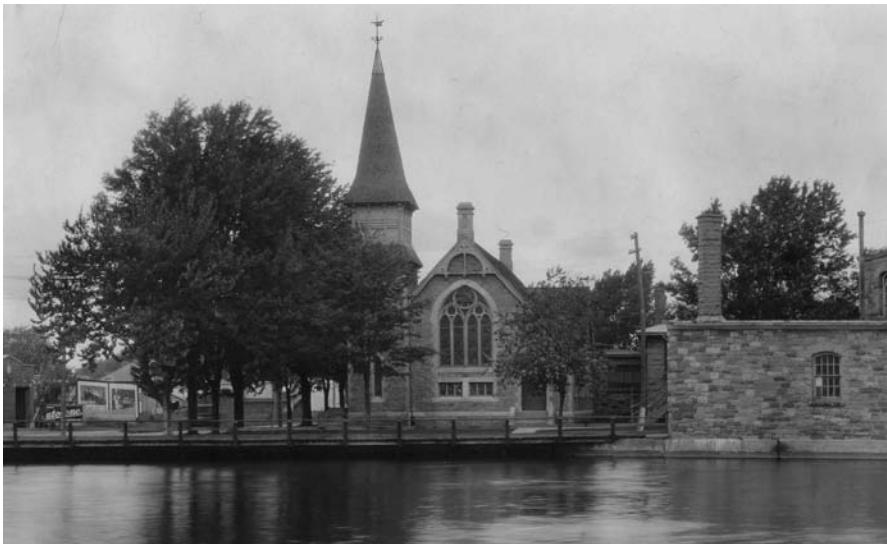
United Church devant la rivière Saint-Charles, première moitié du xx e siècle. Collection Muso – Musée de société des Deux-Rives.

Au carrefour des rues Dufferin et Grande-Île, deux des plus anciennes artères de la localité, est érigée une église en pierre sur un terrain cédé par la Montreal Cottons en 1880. Cette église protestante, anciennement bordée à l'avant par un embranchement de la rivière Saint-Charles, a changé plusieurs fois de dénomination au cours de son histoire. Construite de 1880 à 1882 pour loger la communauté presbytérienne de Valleyfield, elle s'est vue agrandie d'une annexe en 1911-1912, un bâtiment servant de salle de réception et d'école du dimanche pour la communauté. L'église a porté le nom de Valleyfield Presbyterian Church jusqu'en 1925, année de la réunion des Églises presbytérienne, méthodiste et congrégationaliste. À partir de cette date, elle a été connue en tant que Valleyfield United Church . L'église Emmanuel de Pentecôte est devenue sa nouvelle identité vers le milieu des années 1980 et cela jusqu'en 2005. À ce moment, la communauté évangélique qui l'occupait l'a « rebaptisée » église Carrefour du Suroît afin d'évoquer son ouverture sur la région et son idéal rassembleur chrétien.