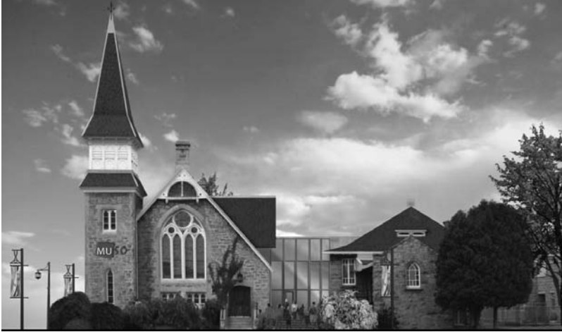
Élévation du MUSO dévoilée en novembre 2009.

vitrée, désormais l'entrée principale et la boutique du MUSO. On a choisi de ne pas faire entrer le public par la porte avant, tel que cela se faisait avec les diverses communautés dans le passé. L'utilisation multifonctionnelle de la nef nous imposait de restreindre l'usage de cette entrée sans pour autant en modifier l'architecture. La nouvelle entrée vitrée au centre, donnant accès à la boutique et aux commodités, est beaucoup plus appropriée pour accueillir les visiteurs.