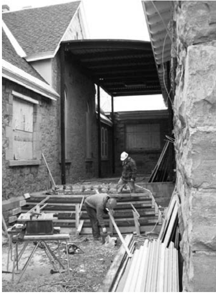
Ouvriers à l'œuvre pour la construction de l'escalier menant au nouvel accueil vitré, 2010.