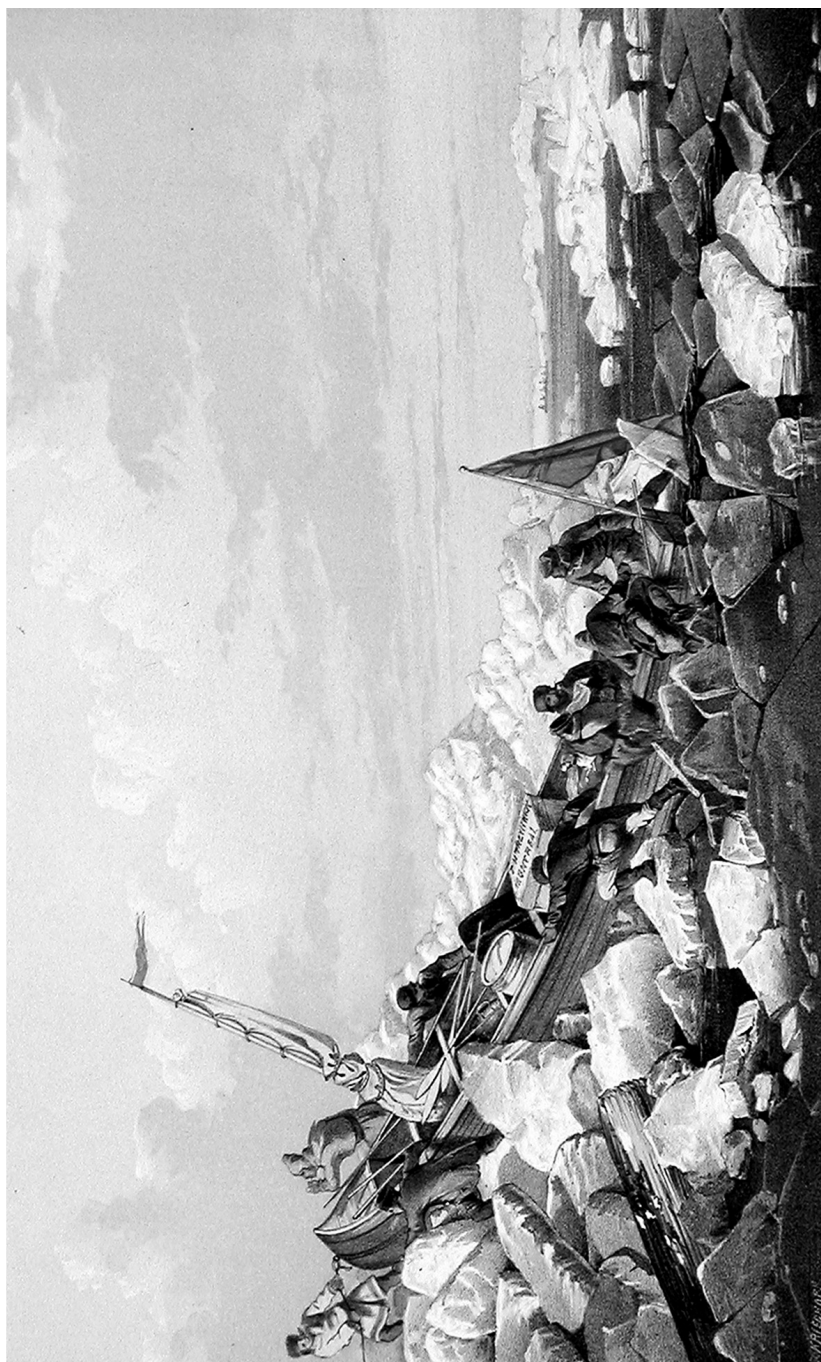
Passengers and Mail Crossing the River. Cornelius Krieghoff, encre et aquarelle sur papier, 1860. Musée McCord d'histoire canadienne, Montréal, n° M15934.47.