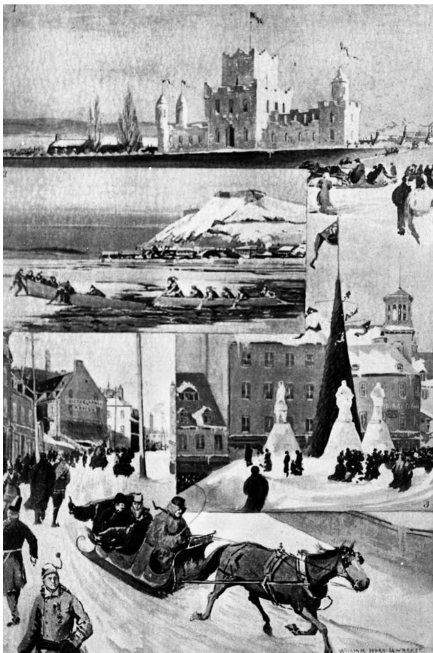
The Quebec Winter Carnival. William Hurd Lawrence, 1894. Archives de la Ville de Québec, n° N009001.