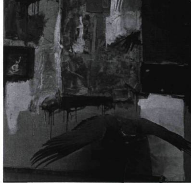
Robert Rauschenberg, Canyon , 1959. Pasadena Art Museum, Californie.

Ceci étant dit, plusieurs des premiers grands classiques américains expriment de façon moins évidente sans doute, mais d'autant plus significative, cette thématique protéiforme des frontières. Dans Walden, or Life in