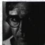
PAUL AUSTER JACK KEROUAC PAUL THEROUX