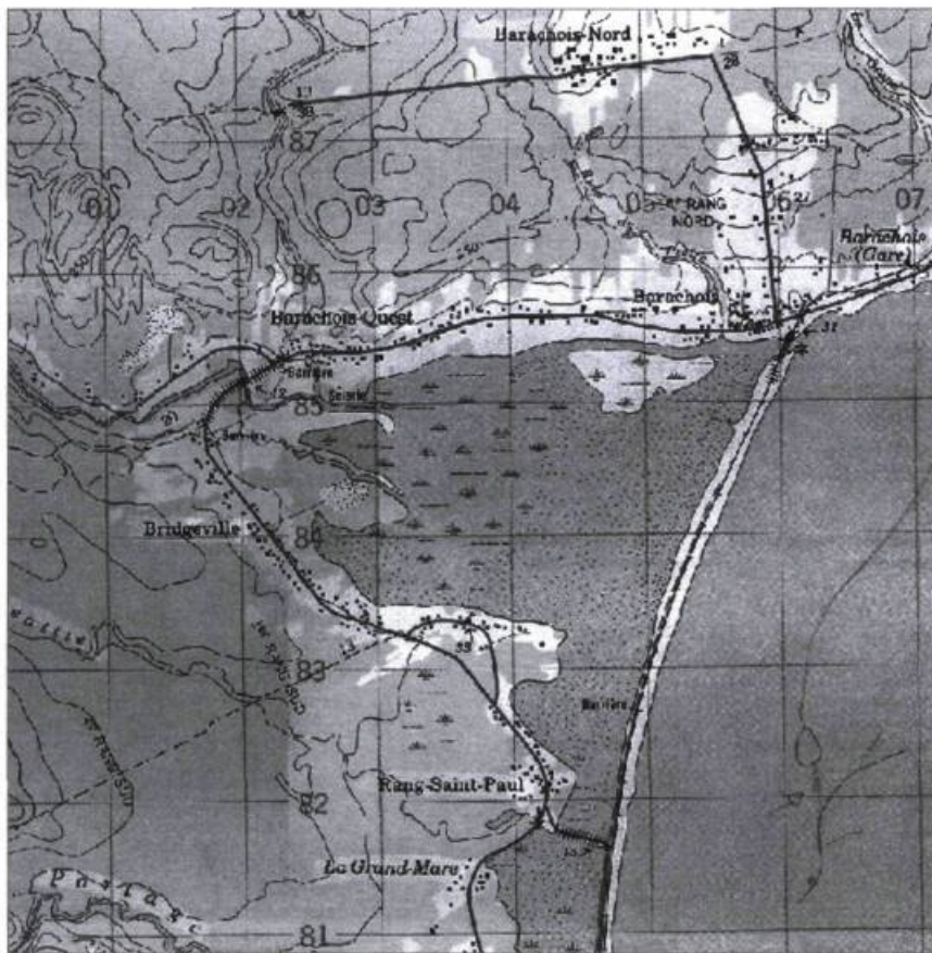
Barachois de la rivière Malbaie en Gaspésie (au sud de Gaspé).

Mais s'il vous était impossible – hélas ! – de plier bagage, d'oublier le chaos de la vie urbaine et de filer en douce vers la mer pour admirer l'œuvre du créateur, je vous recommande chaudement, en guise de compensation, l'audition d'un magnifique documentaire réalisé par Harold Arsenault 1 . Évasion garantie : le barachois, dans son immensité, son insaisissable et indomptable beauté... comme si vous y étiez !