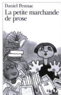
Daniel Pennac La petite marchande de prose

Le statut de non-littérature ou de littérature dont se contente le polar est historique et institutionnel,